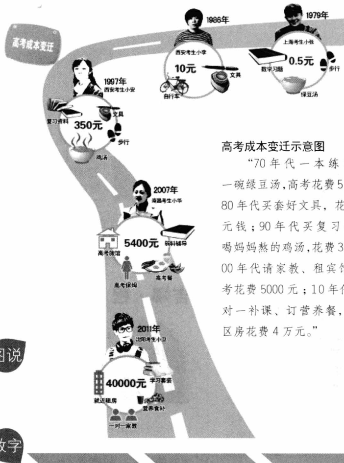
高考成本变迁示意图

“70年代一本练习题，一碗绿豆汤，高考花费5毛钱；80年代买套好文具，花费10元钱；90年代买复习资料，喝妈妈熬的鸡汤，花费350元；00年代请家教、租宾馆，高考花费5000元；10年代请一对一补课、订营养餐，租学区房花费4万元。”