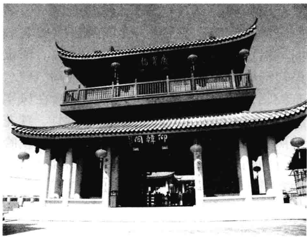
湘子桥东岸广济桥头上的仰韩阁

汛期能观到“湘桥春涨”及“西湖渔筏”之胜景。夏天在凤凰洲能观赏到“凤台时雨”，因潮州地处亚热带，北回归线穿境而过，经常受亚热带季候风海洋性气候的调节，时雨较多。秋天到北堤纳凉观看“鳄渡秋风”。冬天登临金山观看“金山古松”和“北阁佛灯”，使人心旷神怡，浮想联翩。