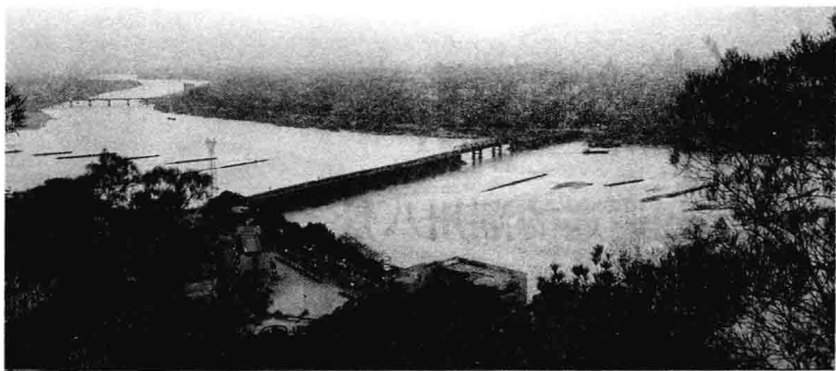
潮州的母亲河——韩江

菊湖云影、蒲涧濂泉、光孝菩提、大通烟雨。地方文雅之士，触景生情而吟诗作赋，画家画，诗人咏，诗配画，画配诗，争相仿效，形成“景、诗、画”并存的“八景”历史文化。这些旅游景观的典雅诗画，已经融入了当地的风俗民情、人文意识，所谓“江山还须文人捧”。