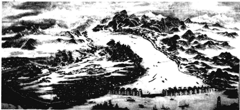
潮州古城图（现存于潮州名城办）

现在大家较熟悉的潮州八景，是自明末清初流传下来的潮州外八景：湘桥春涨（曾名浮桥春涨、长桥榕荫、湘桥仙迹）、韩祠橡木（曾名韩麓橡皮、韩庙棉红）、龙湫宝塔（曾名塔院维舟、龙湫听涛）、凤凰时雨（曾名凤台峙雨、凤台观水）、金山古松（曾