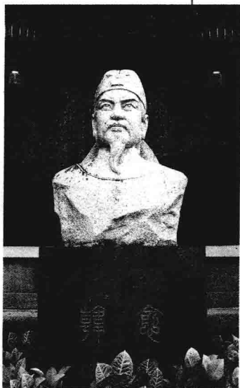
韩祠内的韩愈石像