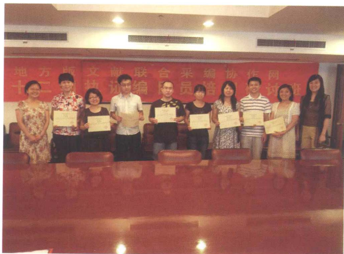
■ 2010年培训班颁发 上载编目员证书