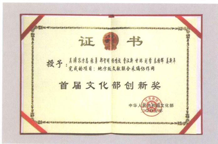
■ 2005年CRLNet获首届文化部创新奖