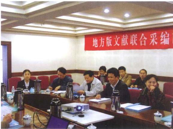
■ CRLNet2005年年会，天津文化局领导致辞