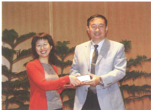
■ CRLNet2007年年会，颁发 数据下载奖