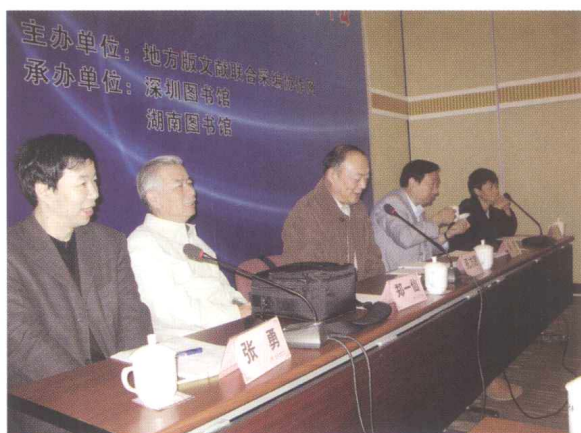
■ CRLNet2008年年会，CRLNet管委会委员