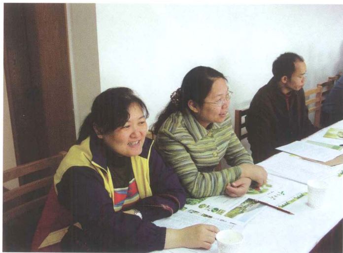
■ CRLNet2004年年会 会场一角