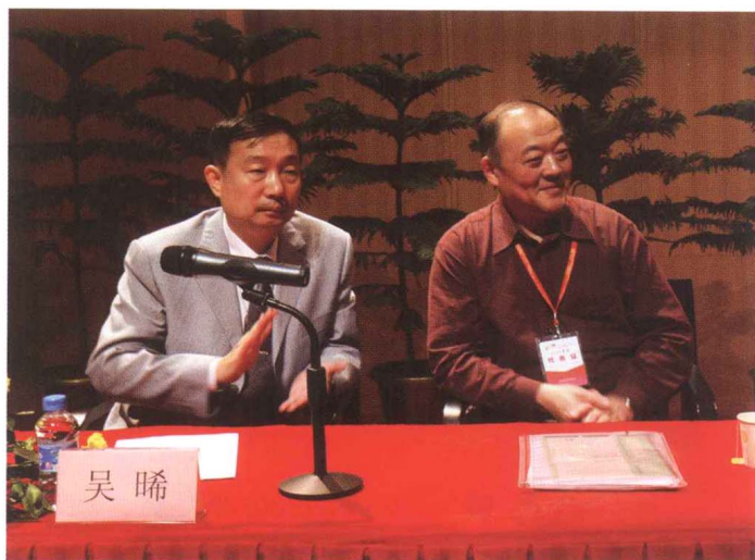
■ CRLNet2007年年会，第 一任、第二任CRLNet 管委会主任