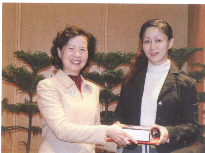
■ CRLNet2007年年会，颁发理论研究奖