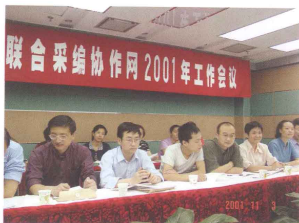
■ CRLNet2001年年会代表在讨论