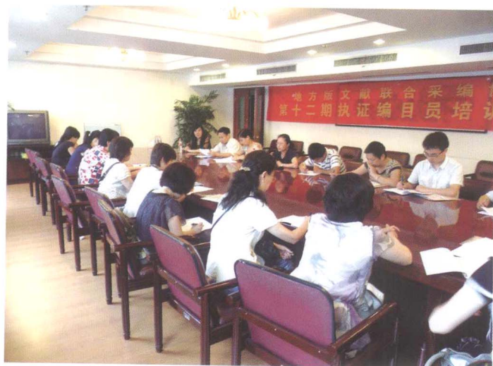
■ 2010年培训班学员在讨论 音像资料著录规则