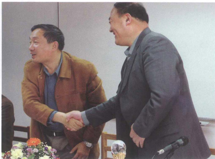
■ CRLNet2004年年会， CRLNet管委会主任 交接