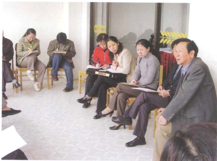
■ CRLNet2004年年会， 专题学术交流