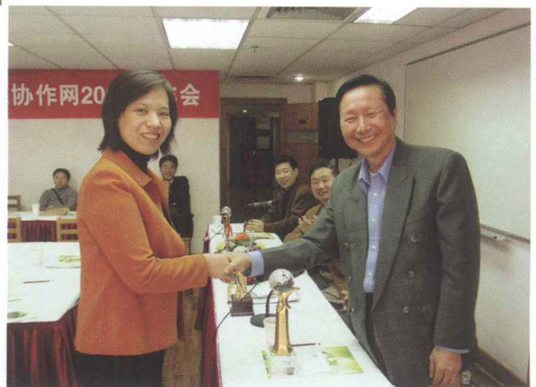
■ CRLNet2004年年会，颁发数据质量奖