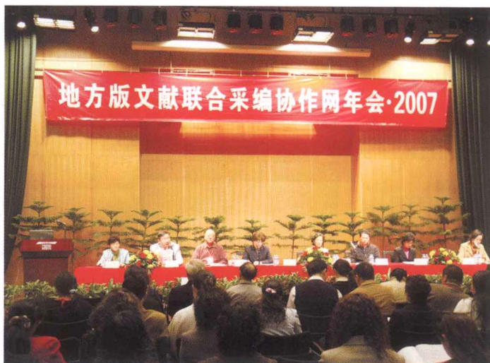
■ CRLNet2007年年会 开幕式