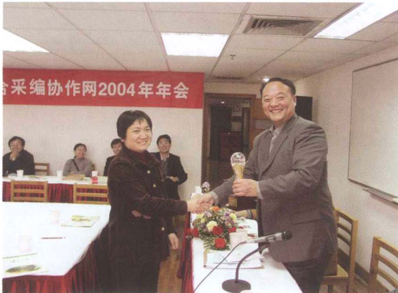
■ CRLNet2004年年会，颁发发展用户奖