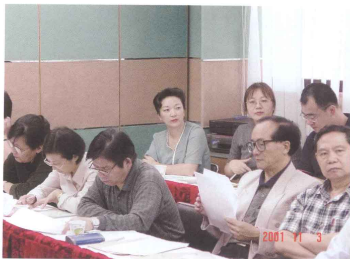
■ CRLNet2001年年会 会场一角