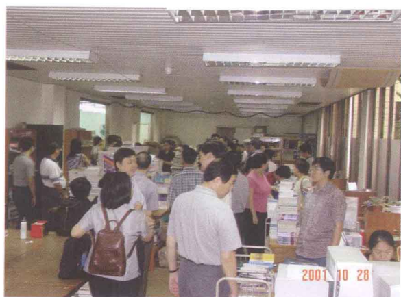
■ CRLNet2001年年会代表参观深圳图书馆采编中心