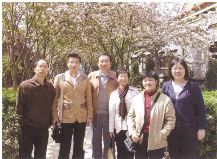
■ CRLNet2005年年会 深圳图书馆代表