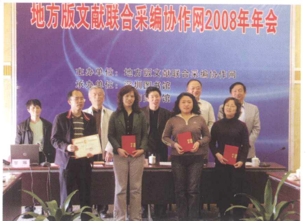
■ CRLNet2008年年会，颁发高级管理员聘书