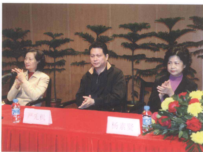
■ CRLNet2007年年会，文化部和深圳文化局领导到会祝贺