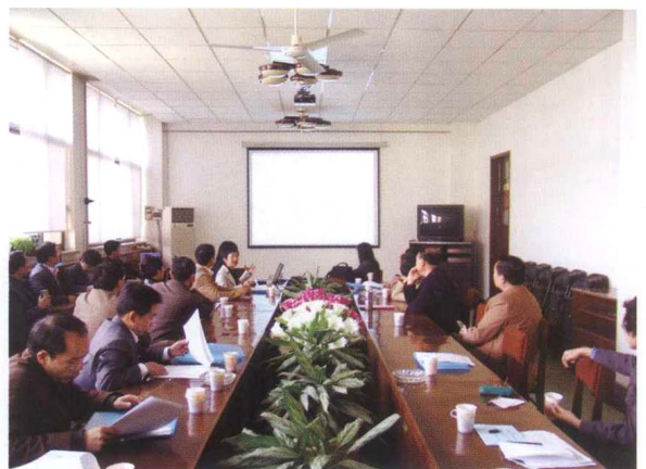
■ CRLNet2005年年会，联编系统演示