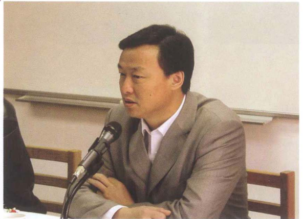
■ CRLNet2004年年会，深圳文化局领导出席并讲话