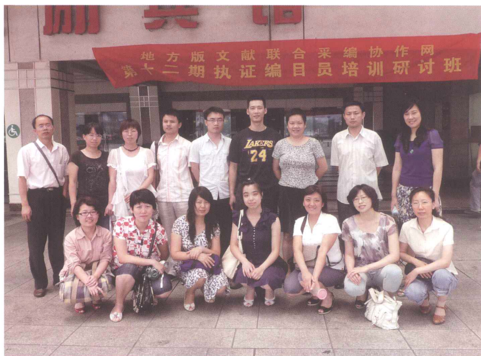
■ 2010年培训班学员合影