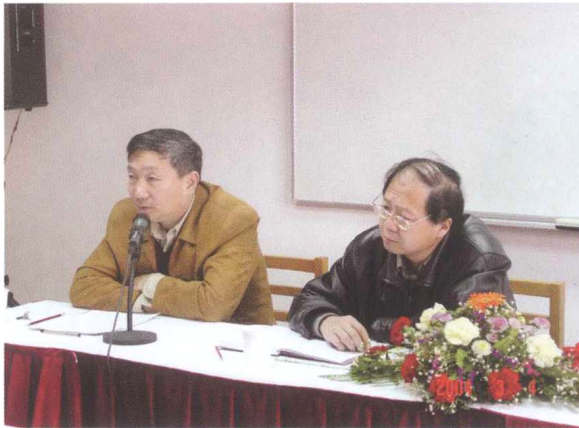
■ CRLNet2004年年会，CRLNet管委会主任与文化部领导