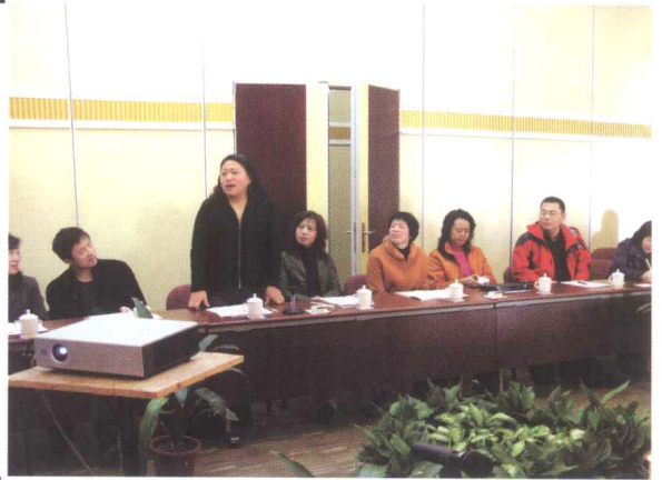
■ CRLNet2008年年会，会议代表自我介绍