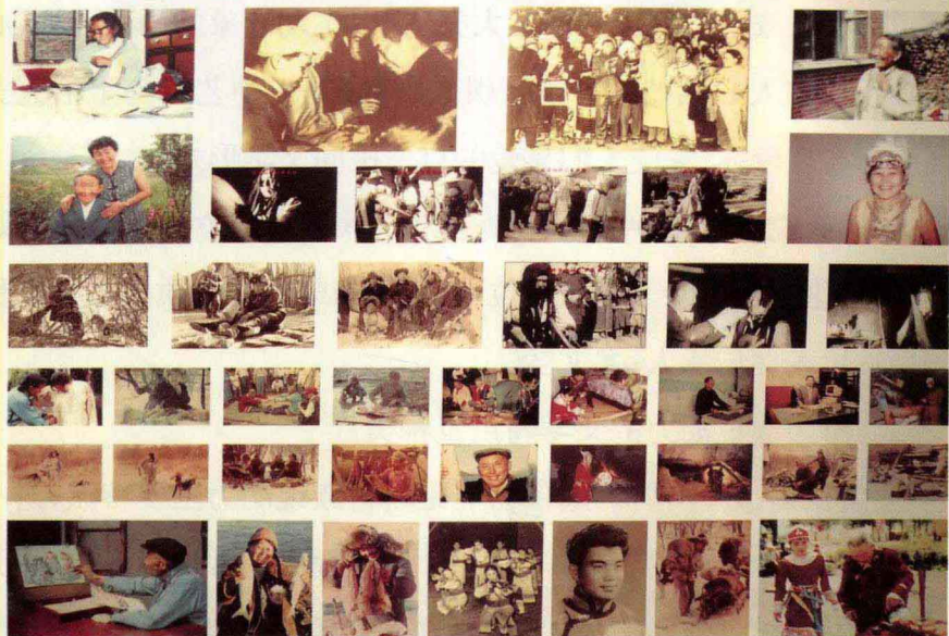
赫哲族渔猎文化生活图片集锦