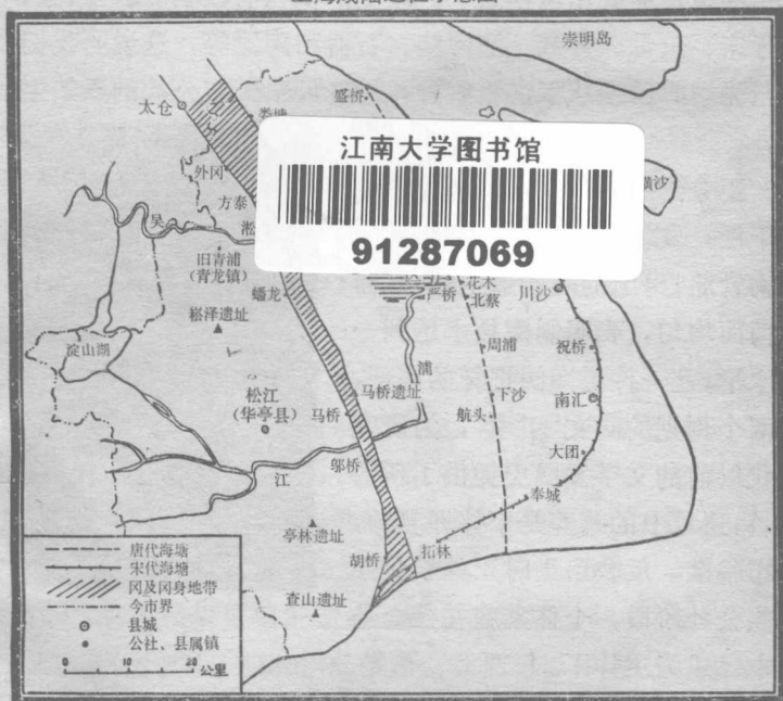
上海成陆过程示意图

大约五、六千年前，上海地区的西部已经成陆，海岸线在今太仓、外冈、胡桥、漕泾一线。沿着这一线，由于长江和海浪带来的泥沙的淤积，地面逐渐加高，形成一条沙带。后来，它的