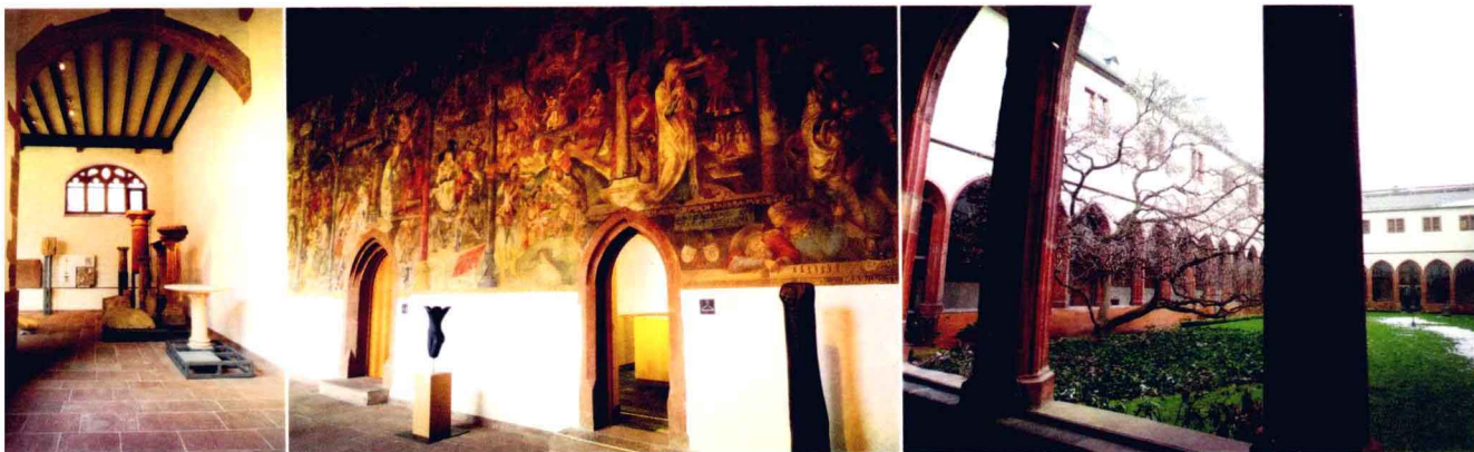
图002 法兰克福考古博物馆内景。博物馆整体建筑原为加尔默罗修道院（The Carmelite Monastery），始建于1246年，后多次由当地贵族捐助得以扩展。礼拜堂和回廊、储藏室等附属建筑现供考古博物馆使用，最早的建筑主体部分属于法兰克福城市历史研究协会。

在法兰克福去的第一个博物馆是法兰克福考古博物馆（Archaeological Museum Frankfurt，图002），博物馆设在一个老修道院内，内部清静宜人，存世的壁画清晰可见，回廊的石板地面似乎还隐约可辨百年前苦修的僧侣们终日诵经时留下的脚步。听上去有点阴森可怖，但总有人对那种腐朽气有点敏感，比如对学考古和美术史的人而言，虽然我也很享受现代气息。壁画下面现在是衣帽间和卫生间的小门，欧洲的博物馆最不让人担心的就是此类服务设施之人性化和周到，推测这些小门内往日曾是僧侣们的居所。