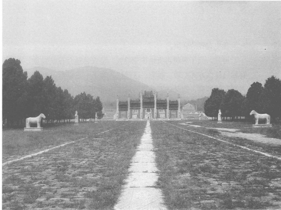
咸丰帝陵寝——定陵，河北遵化昌瑞山下，游人罕至

战争，1856年至1860年又爆发了第二次鸦片战争，其间天地会、捻军等造反，更是数不胜数。内忧外患，遍地硝烟，那才是真正的动乱。中国的历史由此发生了重大转折，也成为后来许多历史学家关注的重点。