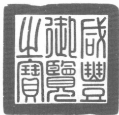
咸丰御览之宝，田黄石。三面有边款，分别题：“惟清”；“坚栗精密，泽而有光。五色发作，以和柔刚。心逸”；“玉蜜滋”

由今上溯一个多世纪，1850年至1861年，咸丰帝奕訢当了11年的皇帝，没有过一天安生的日子。1850年至1864年爆发了太平天国