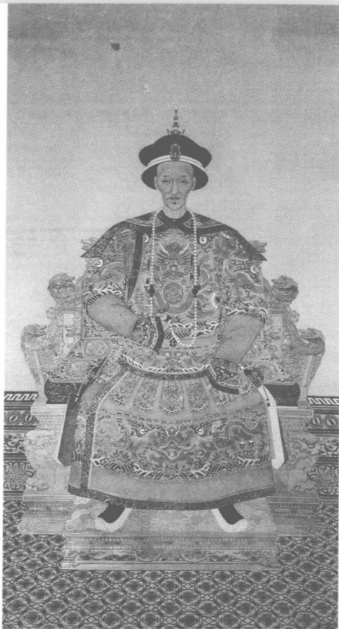
道光帝旻宁（1782— 1850）朝服像

的禁区。凡不利于皇帝及皇室高大完美形象的事件，官方决不可能留下正式记录，而私人悄悄作笔记也有所忌憚，不敢写明消息来源、是否验证等等对今日历史学家作考证极为重要的资讯。结果，各种民间盛传的稗官野史，既有可能是人云亦云的传讹，亦有可能是官方竭力掩盖的确凿的真实，着实使历史学家犯难。若信之，可能有误；若不信，那么只剩下官修文书的冠冕堂皇。此一段奕纬死因的颇具色彩的传说，永远无法得到验证。读者对此不妨姑妄听之，千万别当作肯定的事实。这一类的材料，我在后面还会大量引用，凡难以确认者，亦会不时地提醒读者。