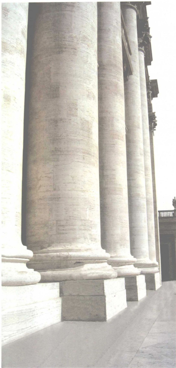
▲▲ 圣彼得大教堂的大理石廊柱

16世纪中叶，文艺复兴运动已经走向了尾声，保守势力再度占了上风。特伦特宗教会议规定，天主教堂必须是拉丁十字的，维尼奥拉设计的罗马耶稣会教堂被当做推荐的榜样。1594年，克莱门特八世在圣彼得大教堂新的高高的圣坛上建起了挑棚，建成了钟楼，装饰了中殿。17世纪初年，在耶稣会的压力下，1605年教皇保罗五世下令拆掉了正在建造的教堂正面，任命建筑师马代尔诺在米开朗基罗主持建造的集中式教堂前加了三跨的巴西利卡大厅，这使圣彼得大教堂又变成了拉丁十字架形。到1626年11月，圣彼得大教堂的工程才算