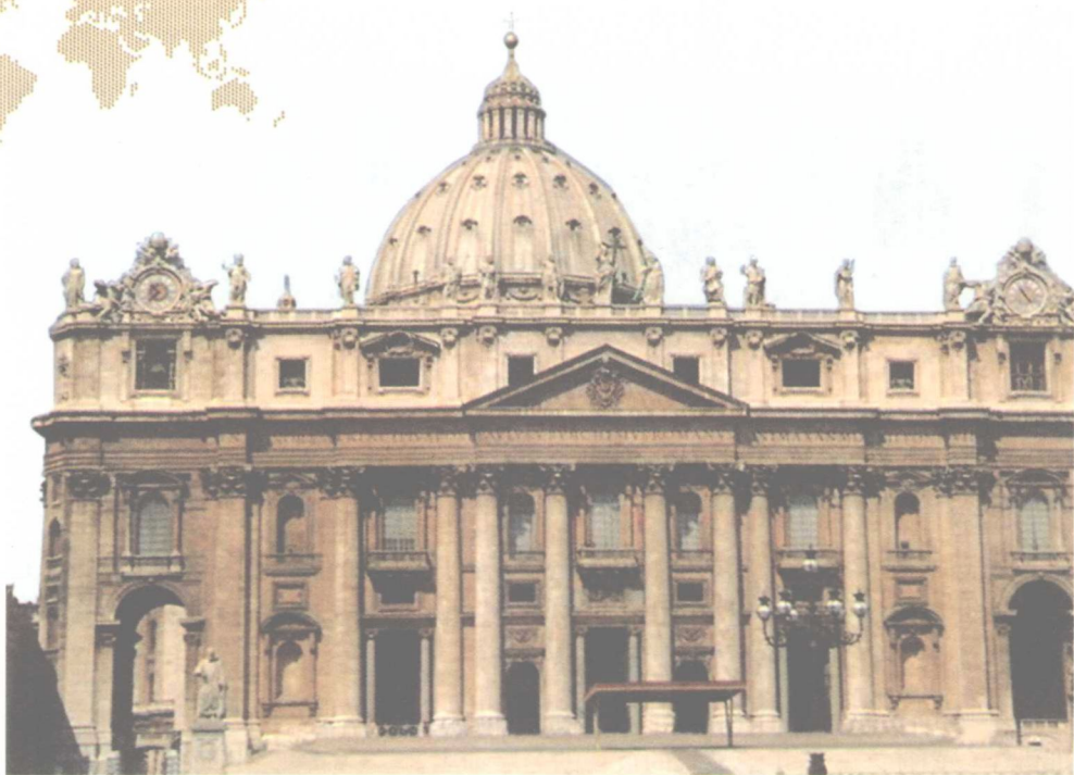
▲▲ 圣彼得大教堂正面入口

彼得原名西蒙，是犹太国加利利省伯赛大的一个贫苦的犹太渔民，他在跟随耶稣前早已娶妻生子，还曾带着妻子周游传道，后来耶稣给他起名叫彼得，他是第一位致力弘扬基督教的使徒。“彼得”这一名字的原意是“石头”，耶稣说：“我要把我的教会建造在这盘石上。”耶稣还说：“我要把天国的钥匙给你。”所以在圣彼得的雕像或画像中，他的手里总是拿着两把钥匙。