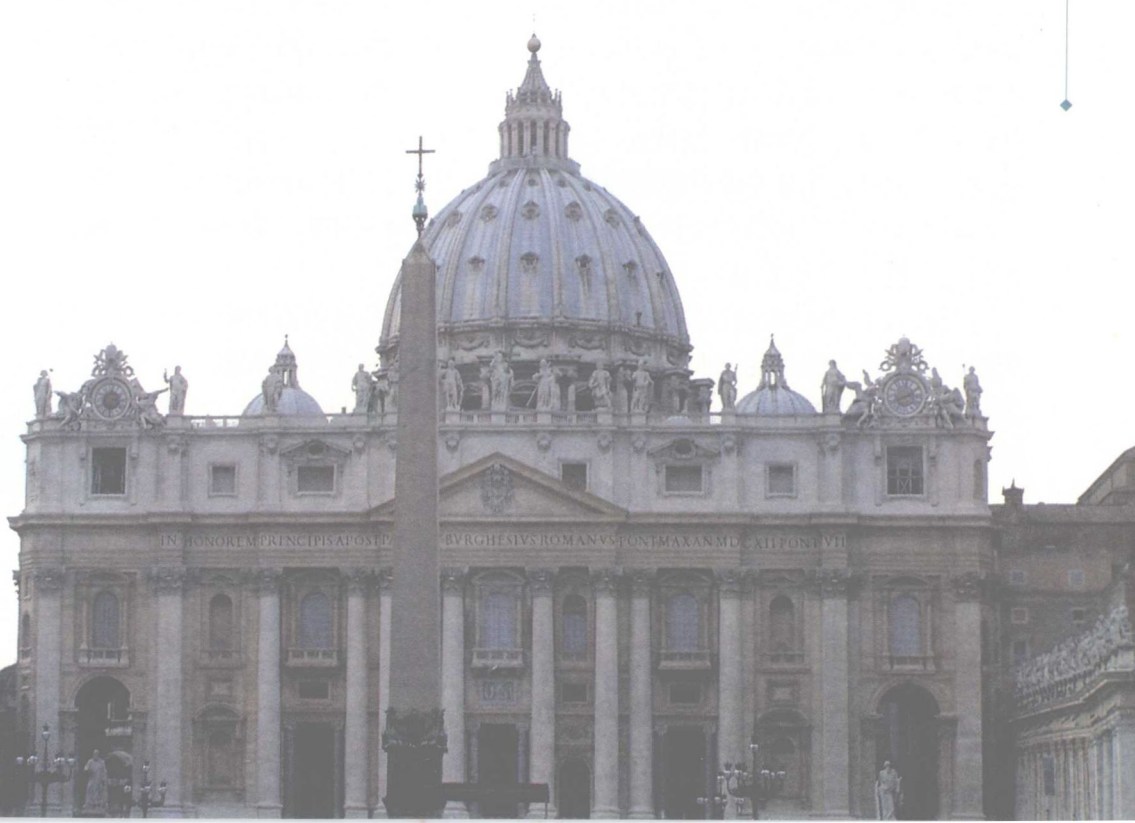
圣彼得大教堂正面

圣彼得大教堂是罗马天主教所在地，也是全世界天主教教徒的圣地。它以耶稣十二门徒之一、年龄最长的彼得的名字命名。