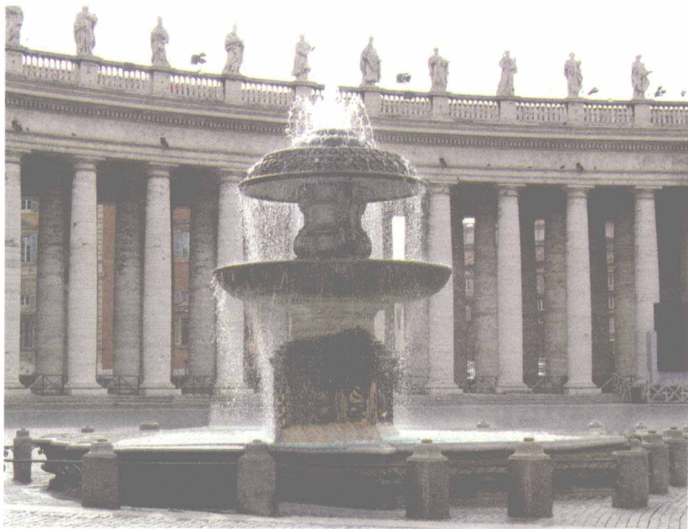
▲▲ 圣彼得大教堂前高达 14 米的大喷泉