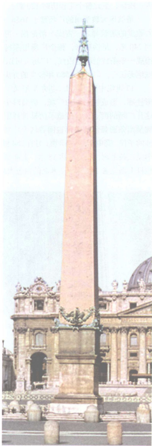
▲▲ 圣彼得广场正中高达41米的埃及方尖碑

1740年，第246届教皇克莱蒙特十二世又在柱顶放了一块据说是耶稣被钉死的木板，以供信徒膜拜。方尖碑四周围绕着14头青铜狮子，还有16根花岗石石柱，外侧另有70根小石柱环绕，四角是4个灯柱，上装艺术灯，夜间灯光开启，更显出方尖碑的高大。在这两圈圆石柱之间的地上，一些直径约一尺左右