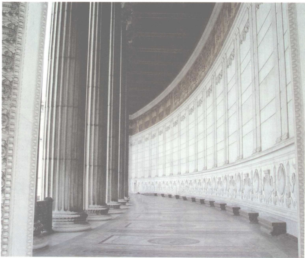
▲▲ 圣彼得大教堂的回廊

17 世纪中叶，G. L. 贝尔尼尼又于 1656—1657 年在教堂前面设计建造了环形柱廊，形成椭圆形的广场，椭圆形平面的长轴为 198 米。并在南北两端围着这片广场的两边设计建造了两排排列整齐的高大石柱，形成一个梯形广场，回廊呈两条圆弧形走廊包围着这个广场，各长 148 米，其含义是耶稣基督拥抱他的子民。廊中有方柱 88 根，另有 284 根托斯卡拉式柱子，圆柱横向排列成四行，形成三条走廊，石柱高达 18 米，上面是廊顶，廊顶之上向广场的里侧有石栏杆，栏杆上面立着 142 尊 3.2 米高的白色大理石塑像，每排圆柱（4 根）上面有一尊