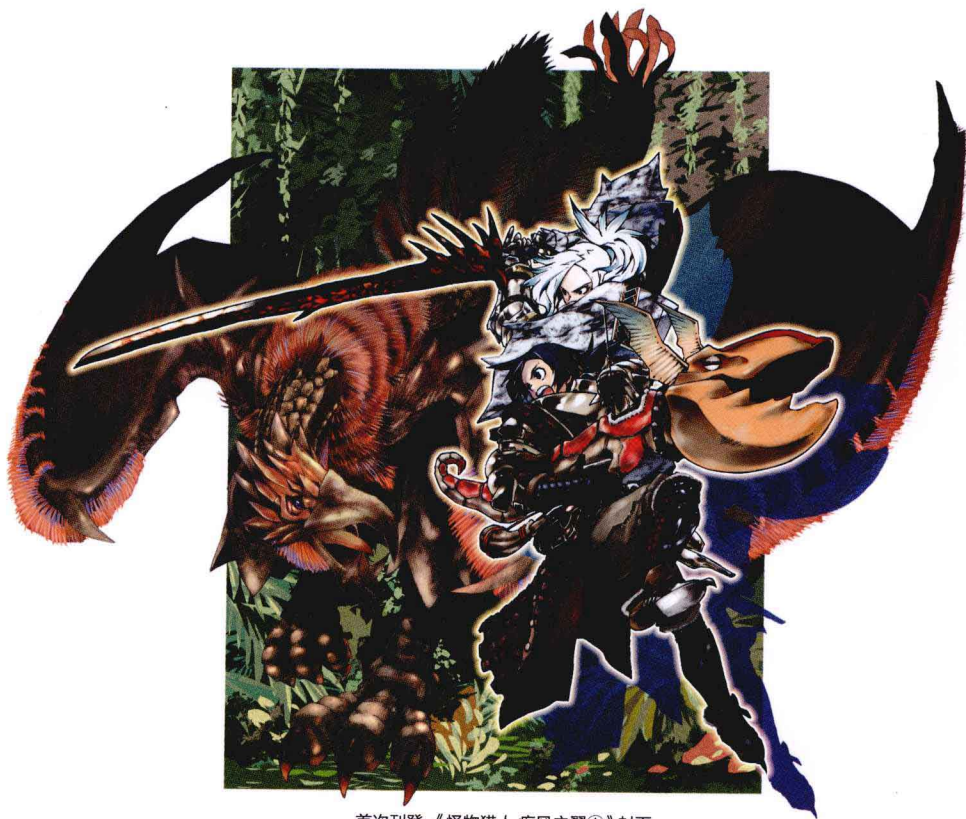
首次刊登：《怪物猎人 疾风之翼①》封面

这个系列的作品真是充满了回忆。之所以这样说，是因为这是我首次的插画工作 ☆ 记得当时完全手足无措，不知画什么好，因此只好向责编先生拜托：“总之就先从最喜欢的怪物开始画行吗？”然后在卷首的地方，以漫画的形式将喜欢的怪物画了出来。也正是从那时起，开始了数码彩绘的艰苦岁月。现在来看，还真是一段不错的回忆呢 ☆ (布施龙太)