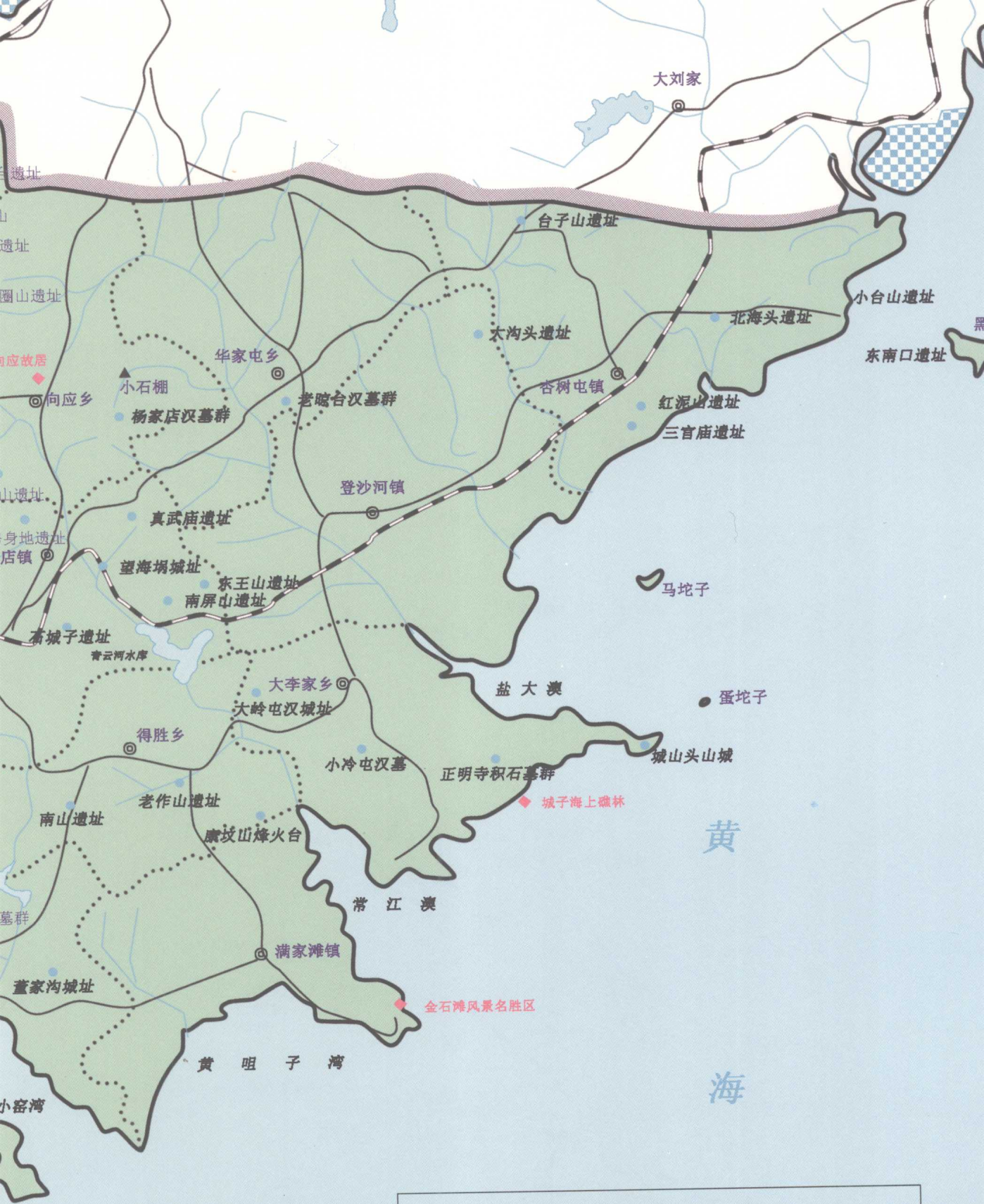
金州新区历史示意图