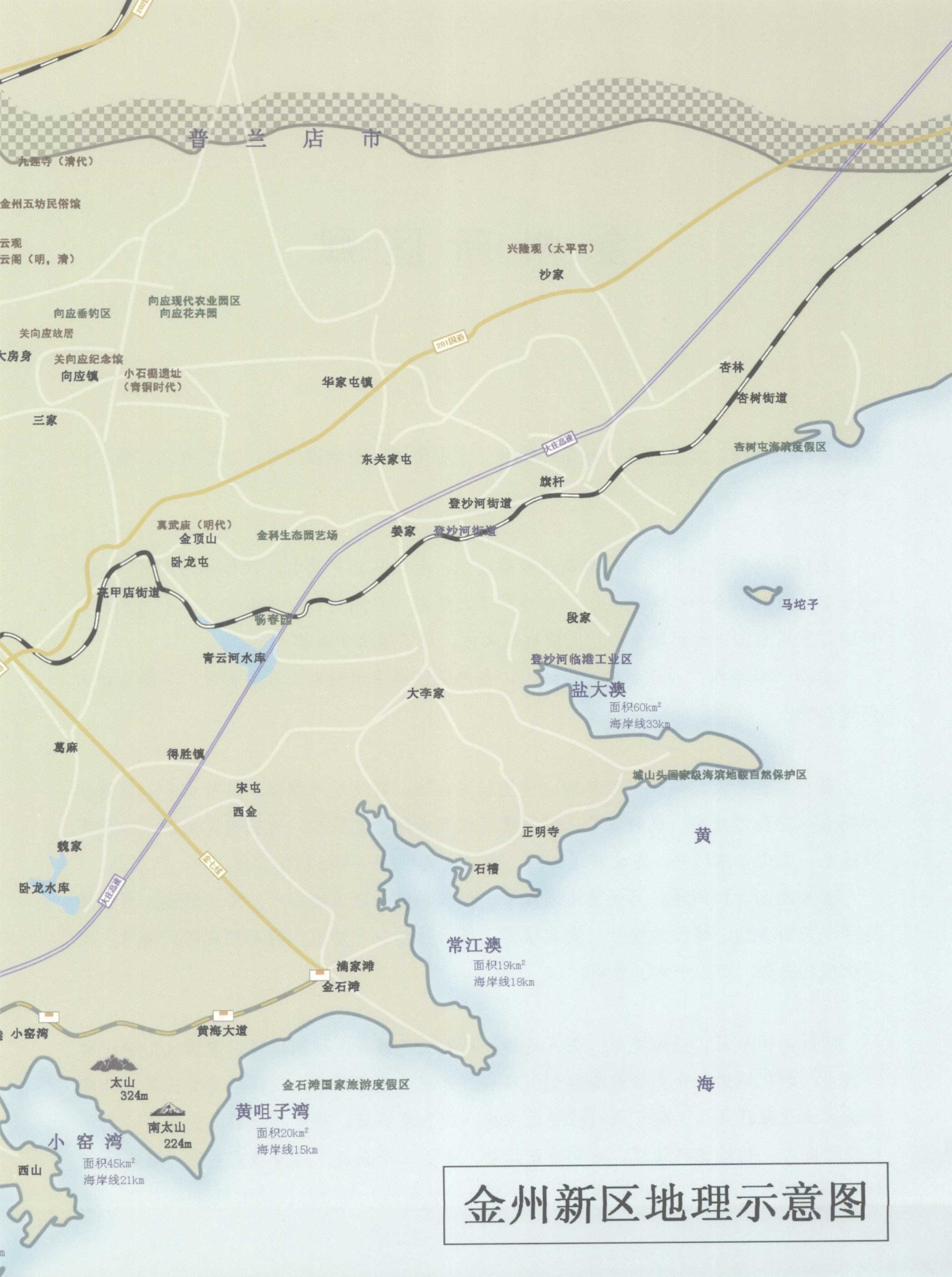
金州新区地理示意图