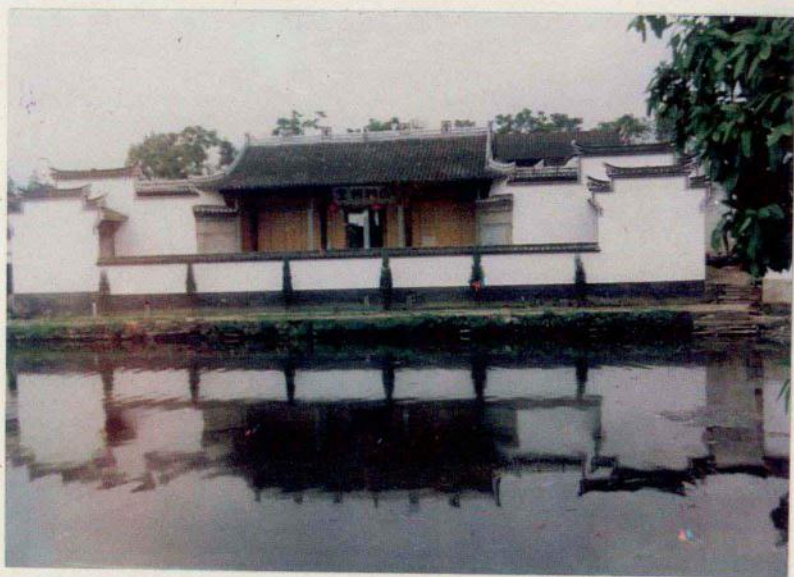
兰溪诸葛臣相祠堂