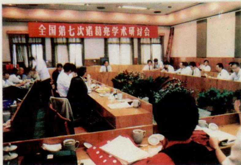
全国第七次诸葛学术研讨会会场