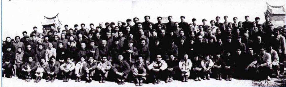
全國首屆許慎學術討論會留影