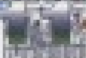
1911年，中國足球隊在天津合影。