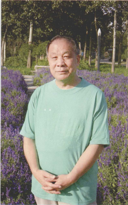
◀ 2009 年秋天留影