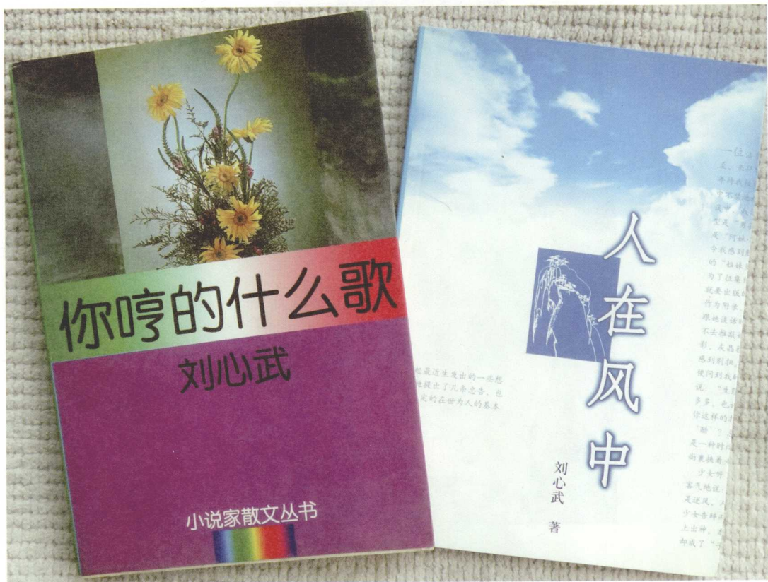
▲ 刘心武散文随笔集书影