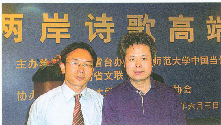
柳忠秧出席海峡两岸诗歌高端论坛