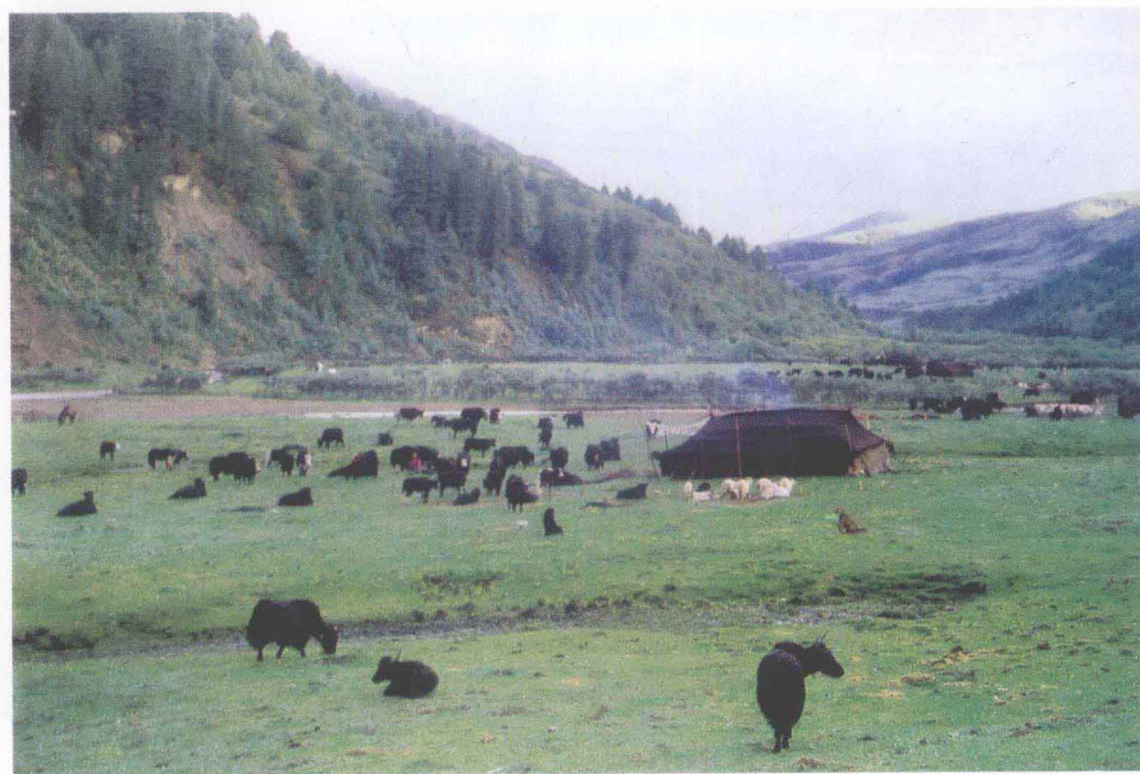
[1] 青藏高原高寒牧场