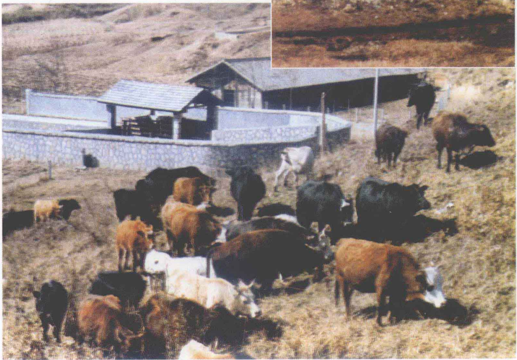
[3] 湖南南山牧场 (围栏、风力提水、牛群)