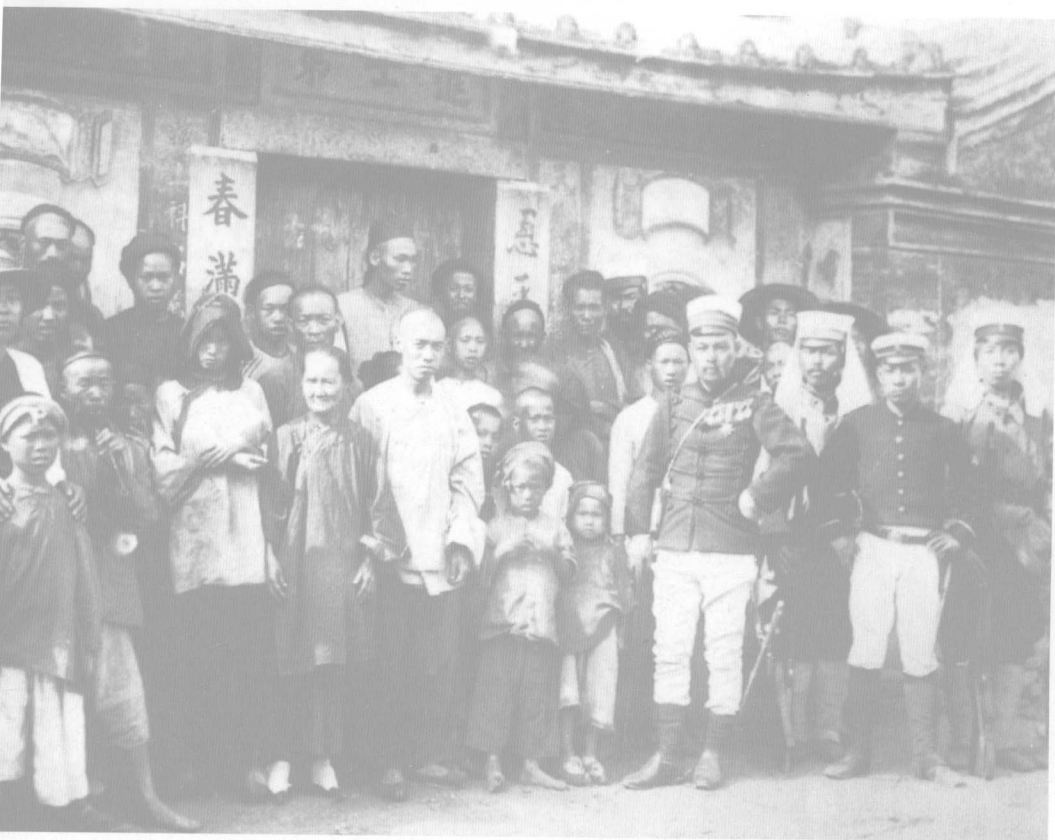
▲隨著甲午戰爭勝利，日軍也占領澎湖，以殖民者的姿態糾集當地民眾合影。

進入二十世紀的台灣，面臨了日本殖民統治手段最嚴酷的初期。明治維新以降，國力漸強的日本開始學習西方列強對外擴張，建立海外殖民地，而台灣成了日本第一個實驗區。台灣成為日本的殖民地源於1894年，中日甲午戰爭爆發，中國戰敗，日本大獲全勝。接下來的外交談判中，日本要求清廷支付巨額的賠款，並割讓遼東半島、台灣和澎湖。1895年初，日軍已實質占領遼東，並將軍事矛頭指向台灣，以取得談判桌上的絕對優勢。對於台灣朝野而言，情勢艱險異常，日艦已在澎湖外海，清廷又軟弱無力。4月間，台灣和中國大陸各省發出的電文如雪片般湧入北京，力陳割台之不可，字字血淚。相較遼東半島則是列強勢力的緩衝區，日本在列強的干預下最後放棄遼東，台