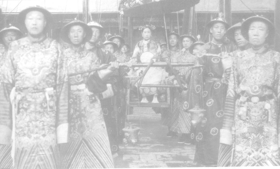
▲晚清中國的最高統治者慈禧太后乘轎出巡，標誌著這個帝國的末代景象。前為慈禧所寵信的總管太監李蓮英（右）及二總管崔玉貴（左）。