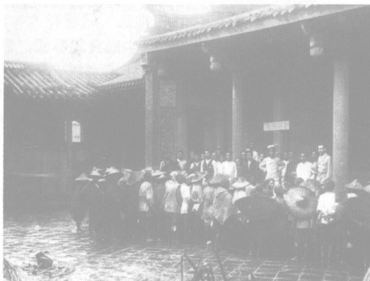
▼日軍占領新竹後，在廟宇召集民眾講話。

總之，日本殖民統治之始，一方面血腥鎮壓武裝抗日活動，另一方面則對全島進行全面墾殖工作，設立近代化的經濟、教育和文化設施，教育台民服從當局，視日本天皇為至高無上的象徵，以使台灣有效支援日本帝國的擴張任務。此一政策就其目標而言大致尚屬成功，此後數十年日本據台期間仍有許多反抗事件發生，但其統治大抵可謂穩定，將台灣資源做了廣泛開發與利用，並使台灣成為日本在二次大戰時重要的南進基地，對日本在近代的擴張扮演著重要的角色與支柱。