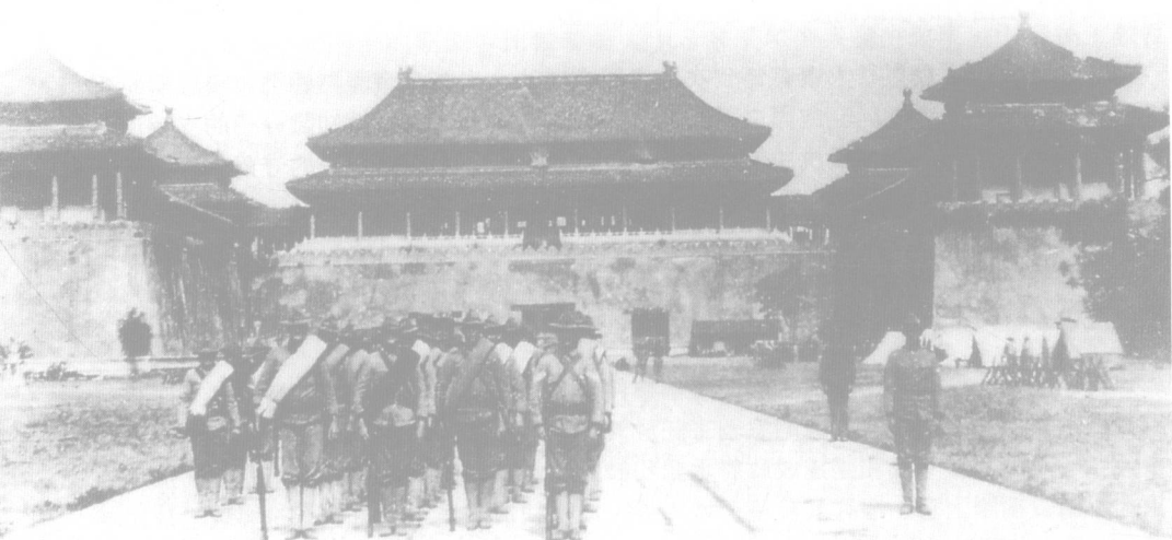
▲八國聯軍進入紫禁城，慈禧太后早已與光緒皇帝倉皇出走，經太原逃往西安。

5月間，慈禧召開四次御前會議，籌議和戰，其中慈禧、端親王載漪、協辦大學士剛毅及一批守舊大臣，力主對各國開戰，圍攻使館，盡殺使臣。然而光緒、吏部左侍郎許景澄、戶部尚書立山等卻力主萬萬不可，認為義和團縱有邪術，自古及今，斷無仗此成事者。不過這些理性的意見卻無法阻擋慈禧的懿旨，於是25日慈禧正式下詔對外宣戰，清軍和義和團開始圍攻使館。相較於北方的對外宣戰，東南各省大臣對局勢的真偽卻心知肚明，眼見大難將至，兩廣總督李鴻章、兩江總督劉坤一、湖廣總督張之洞共扶危局。他們在上海與駐滬各國領事簽訂保護東南章程九條，使得東南免於兵災。