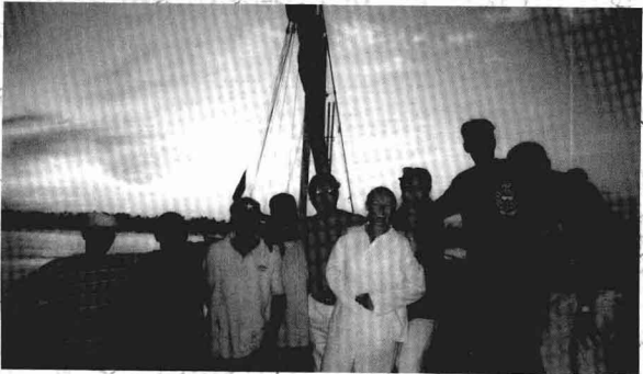
“埃及之旅”在尼罗河上与黑人船员合影