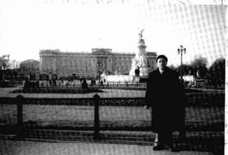
在英国作访问学者时于伦敦白金汉宫前留影 (2001年1月16日)