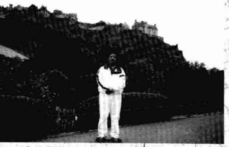
英国爱丁堡留影 (2000年夏初)