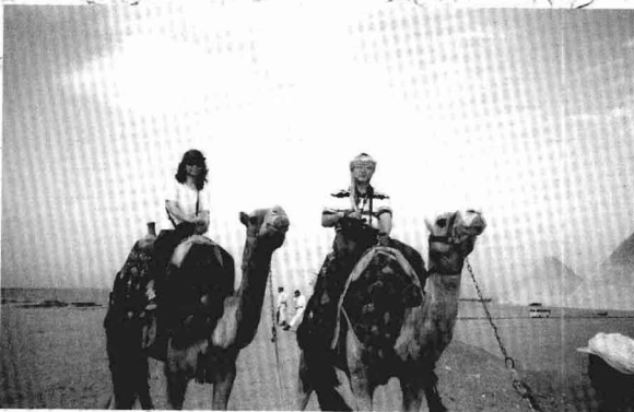
和妻子在金字塔前方合影（2000年10月24日）