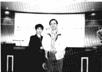
和妻子在香港中国法律律师事务所 前台合影(1998年)