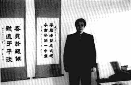
大地所主任办公室赴港工作前留影 (1998年5月)