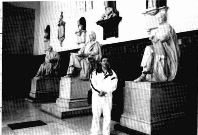
剑桥大学留念 (2000年7月16日)