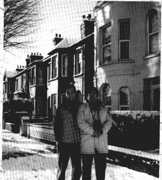
和在英国留学的儿子合影于圣·埃尔本小城的居所前（2000年12月29日）