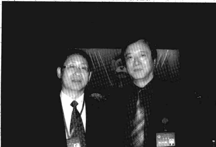
出席政协北京市第十一届委员会第二次会议期间留影