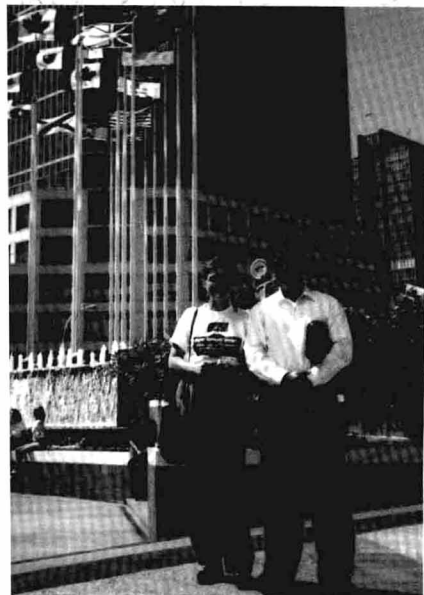
1996年8月作为中国律师代表团成员访 问加拿大时,与加拿大律师同行合影