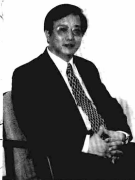
香港律所合伙人办公室留影 (1998年6月)