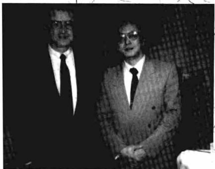
1993年12月作为中国政府法律代表团的 法律顾问访德期间,与当地同行合影