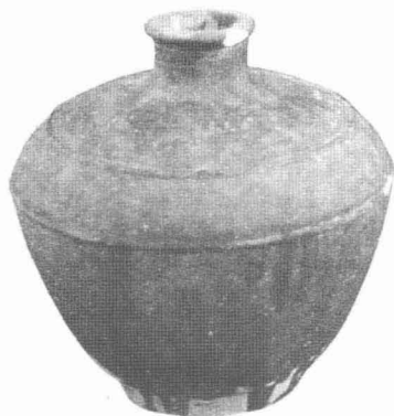
1915年巴拿马万国博览会茅台酒瓶