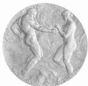
巴拿马万国博览会金牌背面