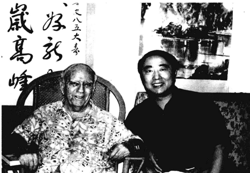
作者于1998年7月13日采访爱泼斯坦。摄于北京友谊宾馆爱泼斯坦家中。在20世纪二三十年代活跃在中国的外国记者中，爱泼斯坦是寿命最长的一位，他于2005年在北京去世。