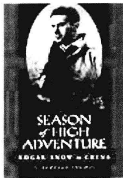
美国学者伯纳德·托玛斯将其撰写的斯诺传记冠名为《冒险的岁月》