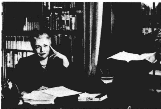
赛珍珠在中国江苏镇江的故居（下图）