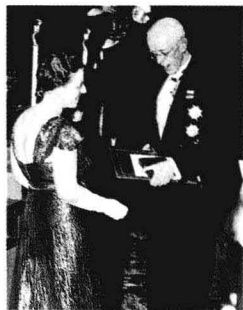
赛珍珠《大地》荣获1938年诺贝尔文学奖