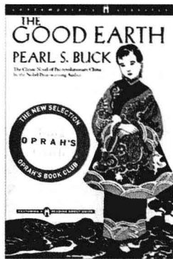
赛珍珠的长篇小说《大地》