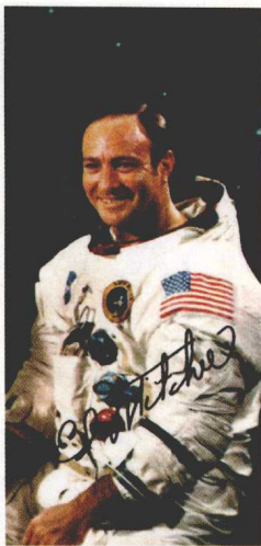
★带有签名的埃德加·米切尔博士照片

听到阿姆斯特朗的报告，NASA指挥中心迅速地频道切换到了安全能通讯频道。他们一点都不想让地球上其他的人，听到阿姆斯特朗传来的报告。多年以后，阿姆斯特朗的助手也证实了此