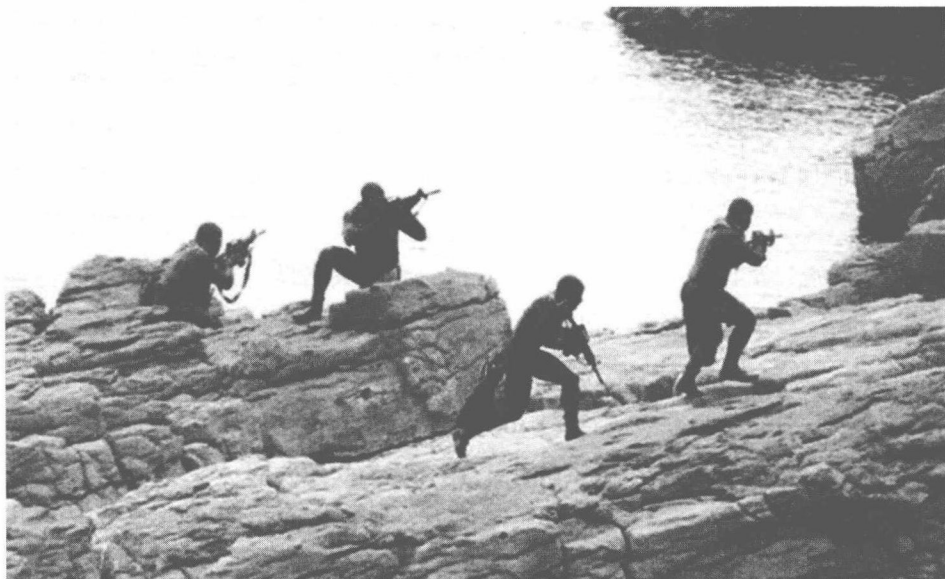
“蛙人”作战是海豹突击队队员必须掌握的作战技能

明的这个呼吸器不会释放气泡，因而极为适合水下秘密作战行动。战斗蛙人队的任务是：用水雷将敌人的船只炸毁、秘密运送物品与人员、秘密支持作战。