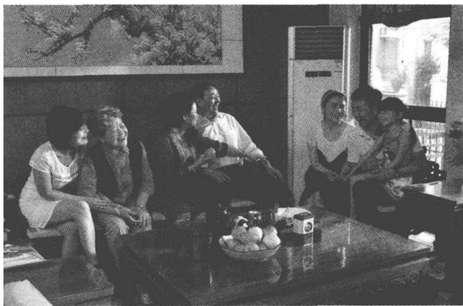
快乐幸福的一家人