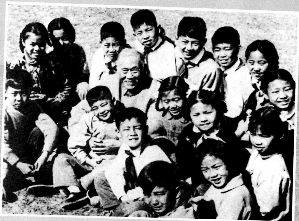
徐特立与少年儿童在一起。