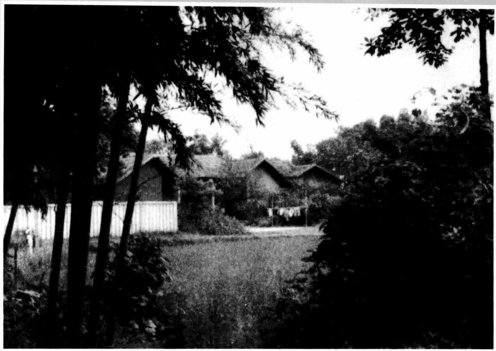
今日长沙县五美乡荷叶墩，徐特立的诞生地。