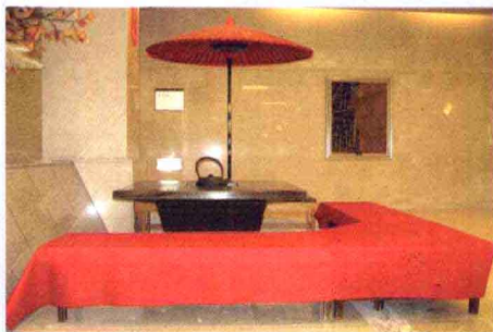
④ 高山市Tourist国际 饭店的日式摆设