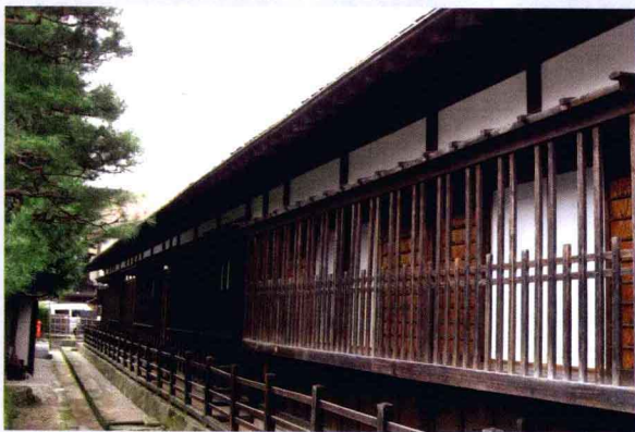
④ 高山市阵屋迹的旧屋

古城。每年春天及秋天举办的高山祭，被列为日本三大重要祭典（另两个为京都的祇园祭和埼玉的秩父祭）之一，这里到处可见飞弹地区的工匠精心制作的日式神轿。到访高山，可以浏览古都风味，同时饱赏传统工匠所创造出来的艺术及文化。东山寺町的寺院及三町通的格子窗民家、造酒屋，更是别具一番风味。