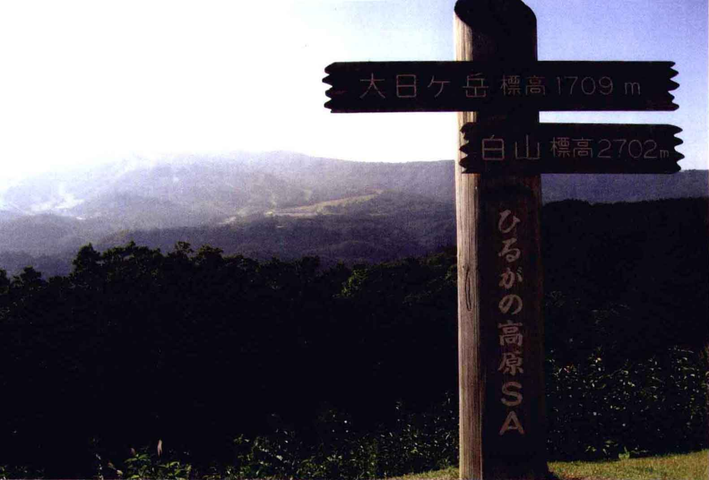
④ 高山市的山脉路径标志以原木打造，与自然景色连成一气