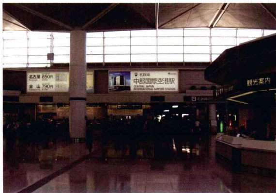
2005年2月17日启用的新名古屋国际空港，是继成田机场后的日本中部机场。

就这样，在我从桃园机场踏上前往名古屋的飞行途中，我即以一种朝圣般的虔诚心情，潜入晴空里，想象着过去未曾谋面的飞驒高山，究竟何等清雅？