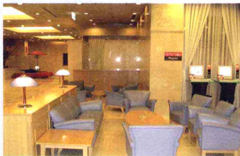
④ 高山市Tourist 国际饭店的正厅