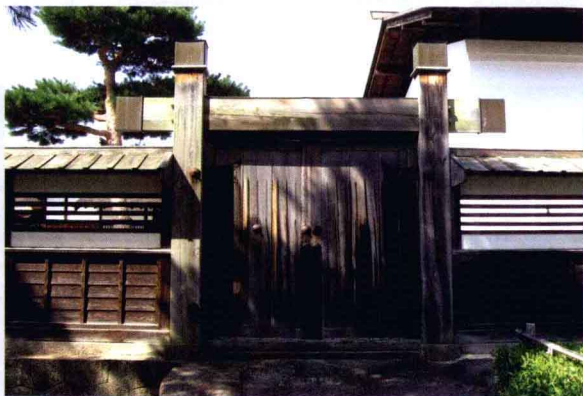
④ 高山市阵屋迹的木制侧门