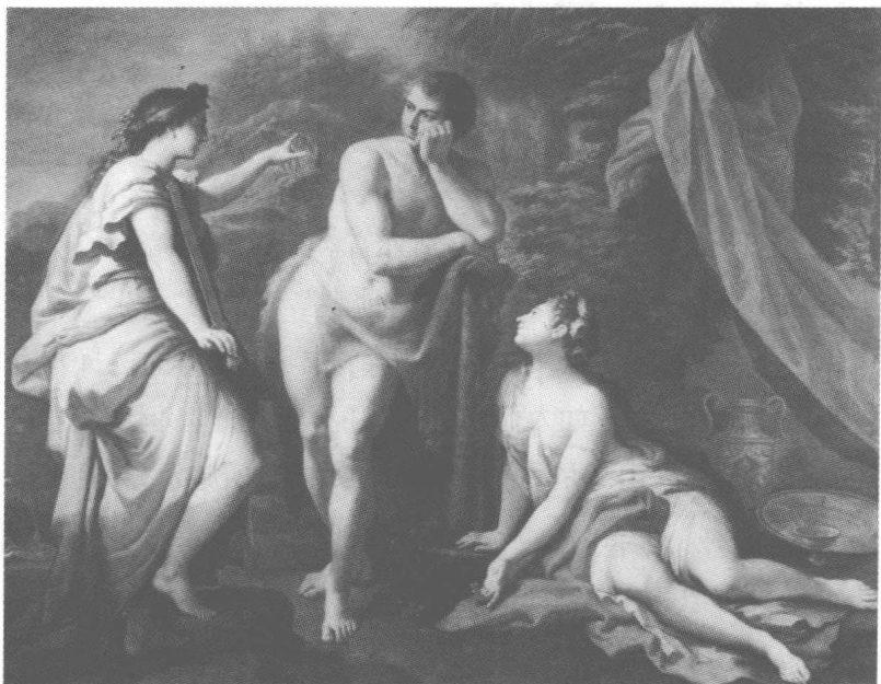
图1《赫拉克勒斯的选择》:美德VS恶行(保罗·德·马泰斯,1712)

吸毒的时候,你只用操心一件事:弄到毒品。不吸毒的时候,你就得操心所有其他乱七八糟的杂事。没有钱:没有酒喝。有了钱:喝得太多。没有女人:玩不起来。有了女人:麻烦不断。你得操心账单,操心吃的,操心某个永远