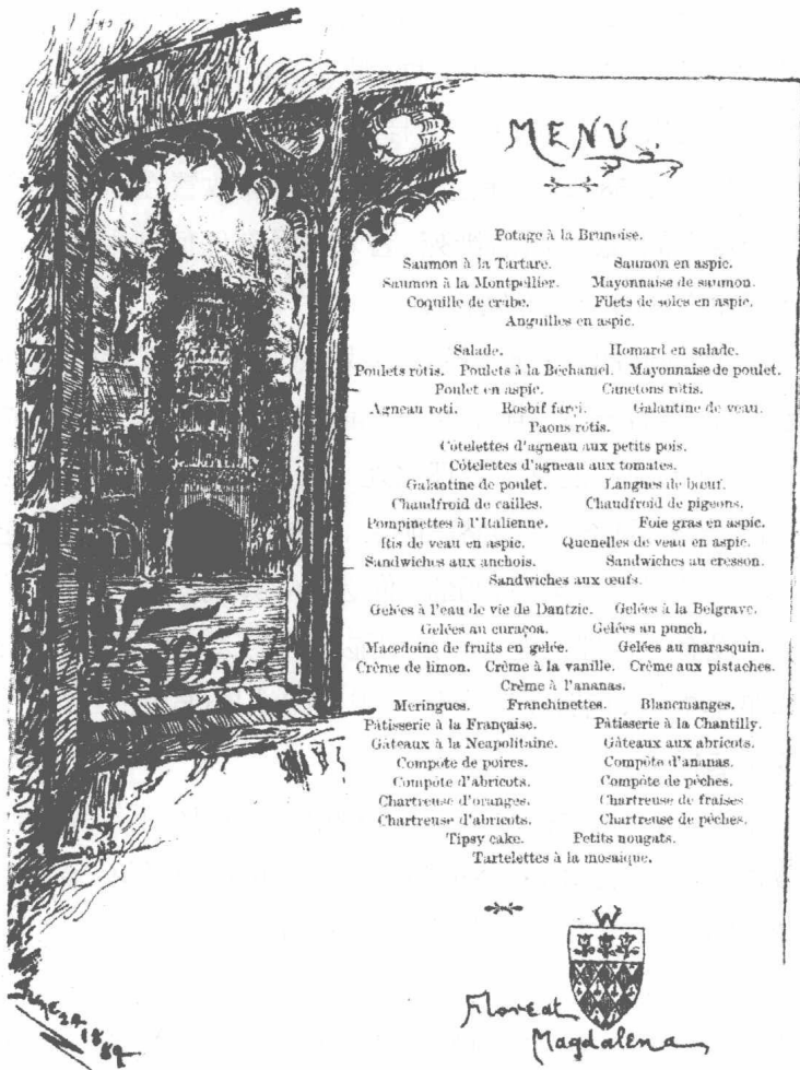
图 2 一份菜单：摩登林学院，1889 年 6 月 24 日

思来理解菜单和选项，这些英文单词或者首字母用了大写，或者被加了引号。)不过，我们必须允许持平，也就是说，同等选择多个选项。例如，只选鳄梨可能与只选熏肉持平。当我们说这两项持平，或者同等选择这两项，仅仅是说我们对两者同等满意。持平并不意味着我们要同时吃两种三明治：面对持平局面，你