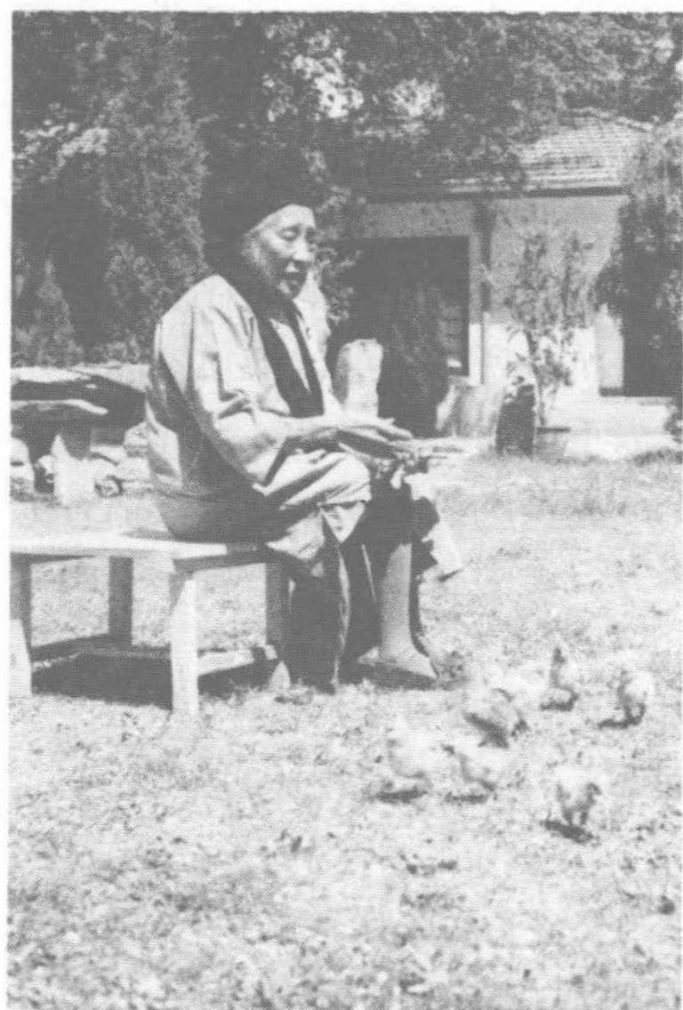
六十年代初何香凝 在北京家中

在桂林定居時，她與李濟深、蔡廷鍇、柳亞子等過從甚密。她時常吟詩抒懷，一九四四年春寫的兩首《感懷》云：