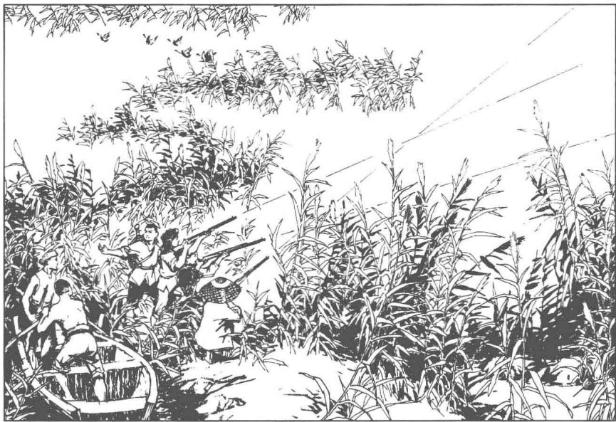
13 湖上，赤卫队员藏在蒿草丛中，朝堤岸上奔来的敌人打了两枪，随又转移。