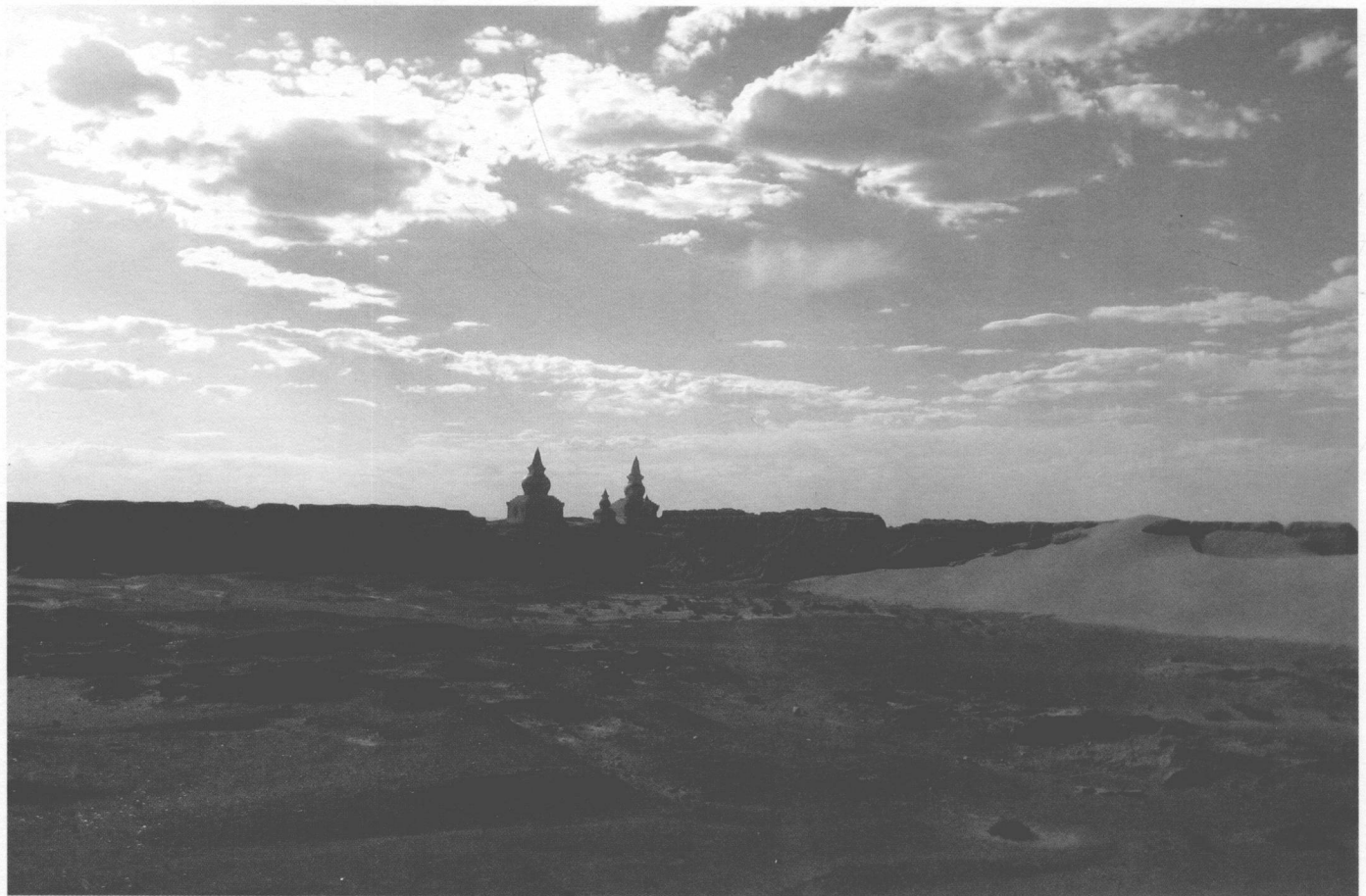
黑水城遺址城内西北角