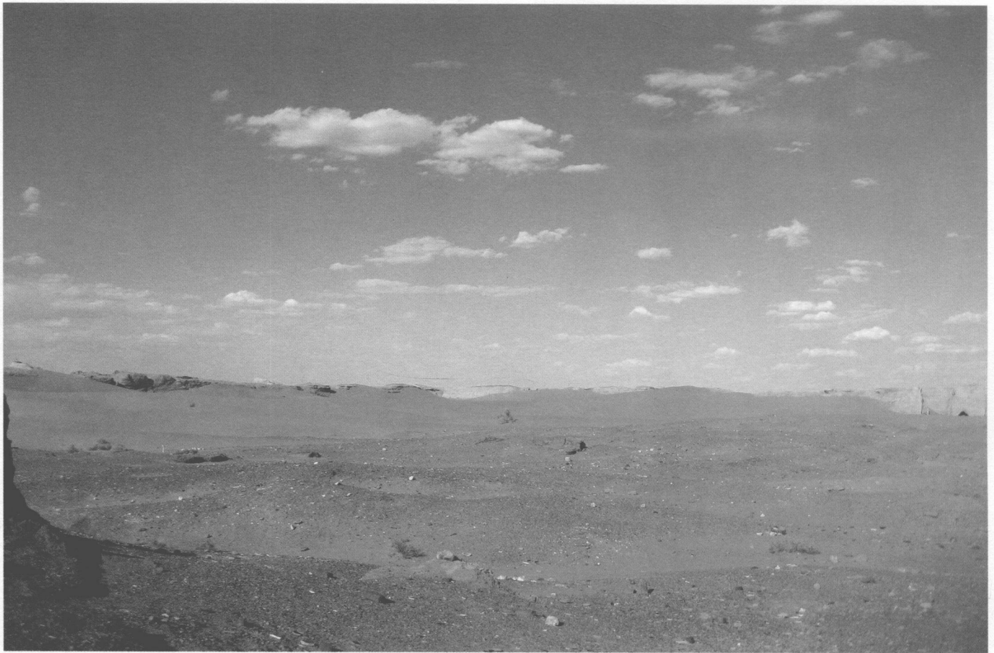
— 黑水城遺址城内東部