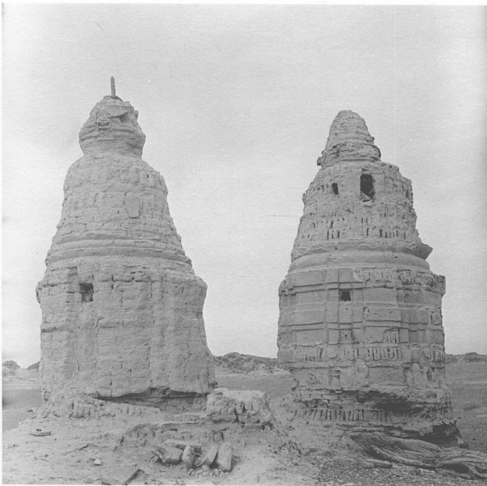
二十世紀八十年代黑水城遺址雙塔