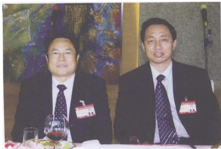
图6 云南省原政协主席杨崇汇（左）与朱德芳合影留念