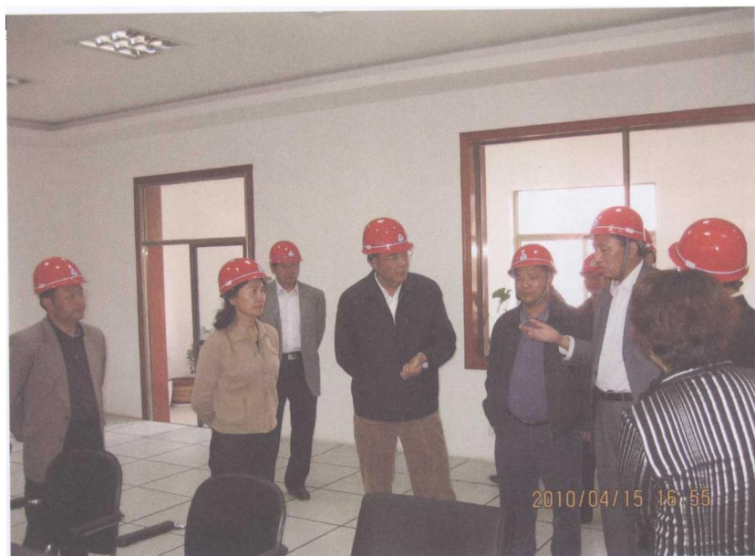
图7 云南省副省长李江（左二）在德鑫集团考察调研