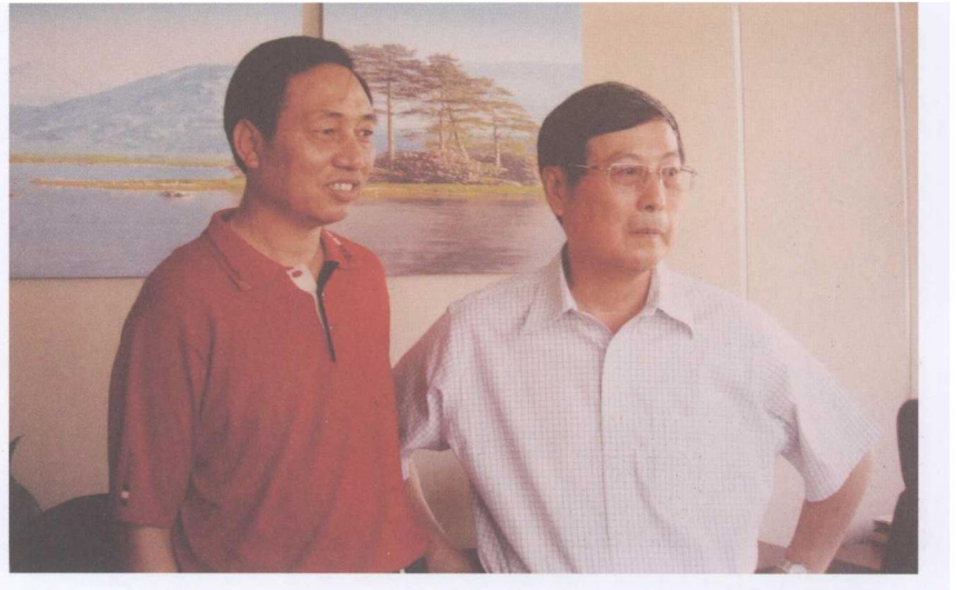
图1 全国政协副主席、全国工商联主席黄孟复（右）亲切会见朱德芳