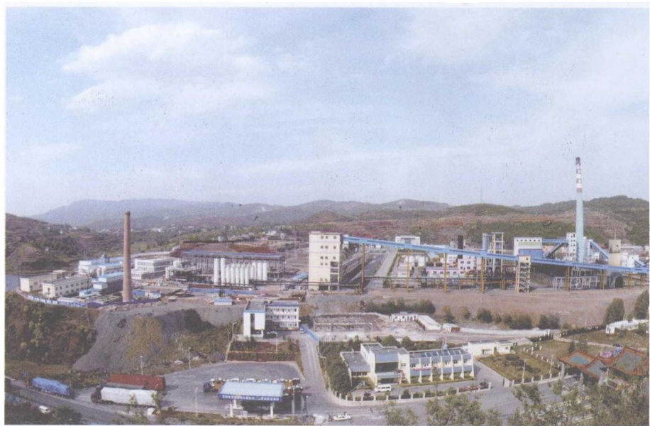
● 图16 云南富源德鑫工业园区全景