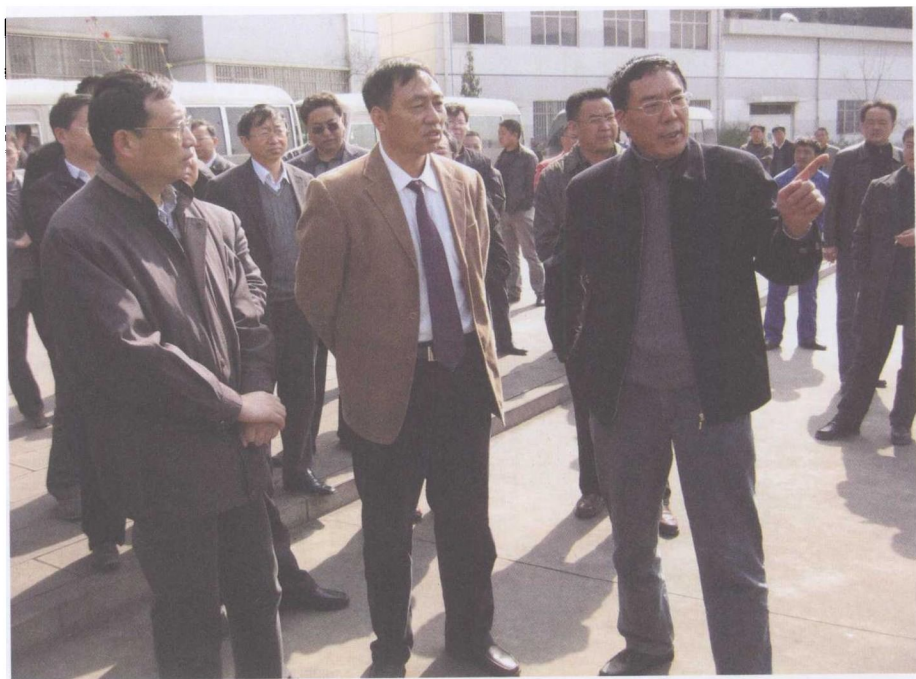
图9 云南曲靖市委书记赵立雄（右一）在德鑫集团视察指导工作