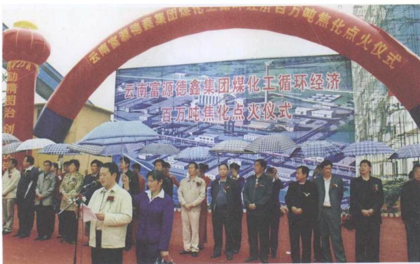
图13 富源县委书记顾琨在德鑫百万吨焦化厂点火仪式上讲话