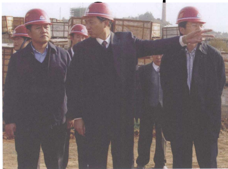
图8 朱德芳向云南省委常委、统战部长黄毅（左一）汇报德鑫集团项目建设工作