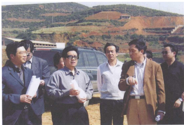
图3 云南省委书记秦光荣（前排左二） 在德鑫集团视察指导工作（前排右一为朱德芳）