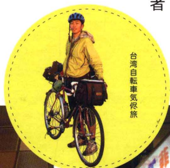
台湾自转车气候旅