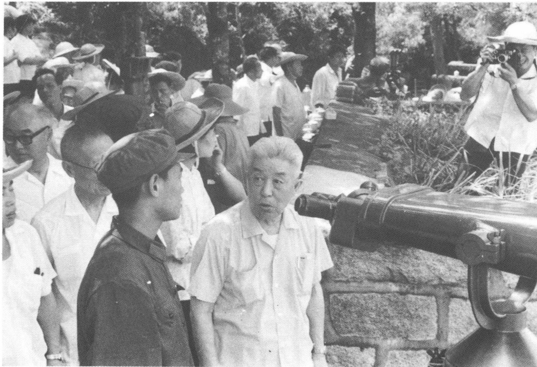
1973年,郑洞国(右前)在厦门鼓浪屿观看金门岛。