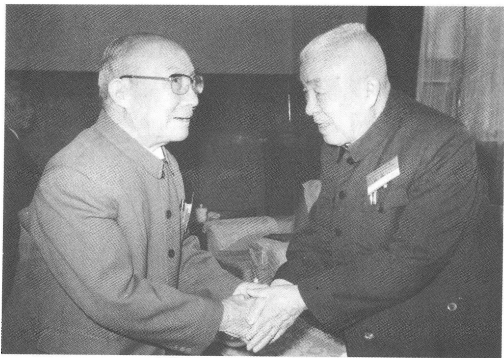
在民革“七大”全会上,郑洞国与屈武主席亲切握手。