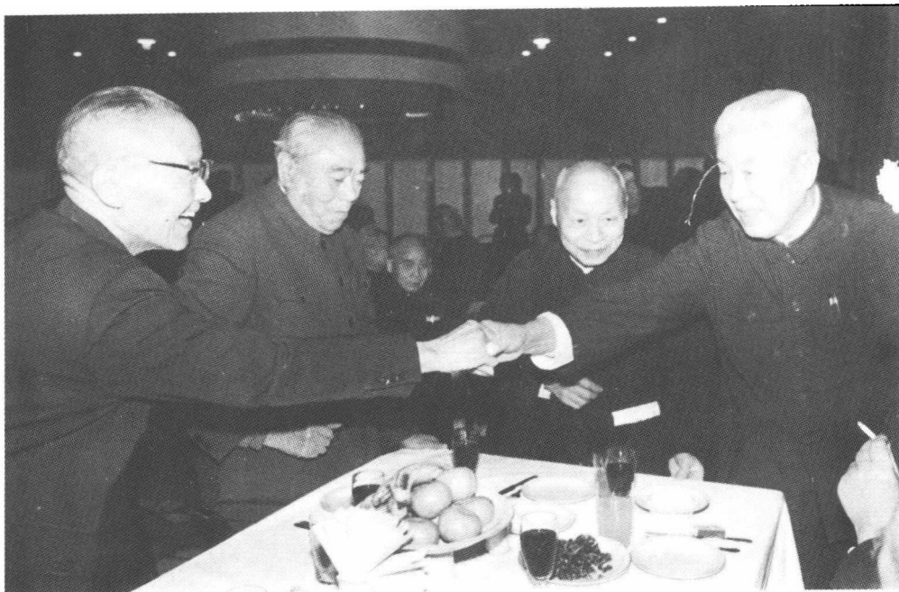
1982年,郑洞国(右一)与宋学范(左二)、钱昌照(左一)、孙越崎(右二)等民革中央领导领导同志在一起。