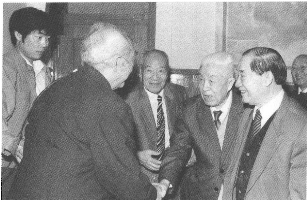
徐向前元帅(前左一)与郑洞国(前左三)亲切握手。前左二为侯镜如,左四为邓文仪。