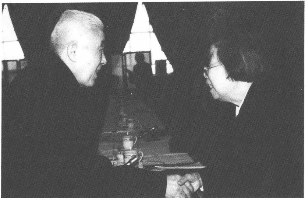
郑洞国(左)与邓颖超同志亲切握手。