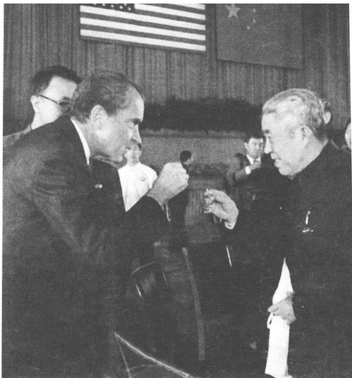
1972年,郑洞国(右)在欢迎美国总统尼克松(左)首次访华的盛大宴会上。