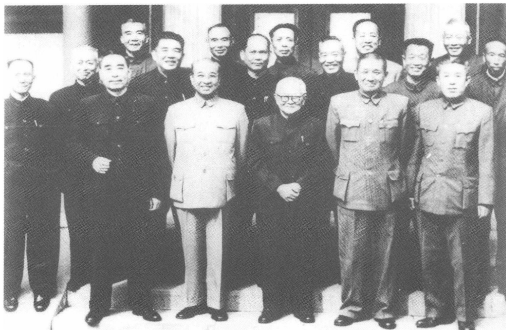
1960年10月19日，周恩来总理在北京颐和园会见黄埔校友。前排右起：郑洞国、张治中、邵力子、陈赓、周恩来。中排右起：周振强、杜聿明、侯镜如、覃异之、唐生明、黄维、李奇中。后排右起：宋希濂、周嘉彬、郑庭笈、杨伯涛、王耀武。