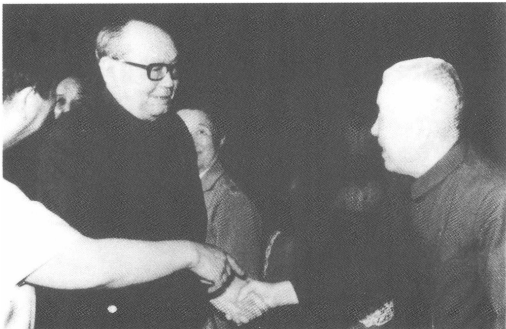
乌兰夫副主席与郑洞国(右一)亲切握手。