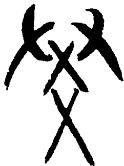
甲骨文的“学”字，有小孩子双手玩爻之象。

万物皆分阴阳，而且阴中有阳、阳中有阴，彼此并非绝无融通的可能，任何一边扩张过度，还会阳极转阴、阴极转阳，造成戏剧性的形势逆转。这种思