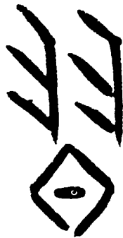
“习”字上半部的“羽”，状如小鸟拍翅学飞。