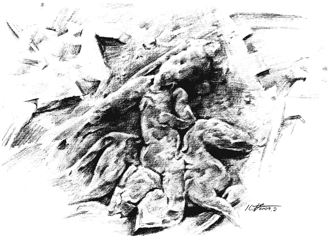
那年凤凰城头上被风蚀的戏曲（纸本、铅笔）黄作林