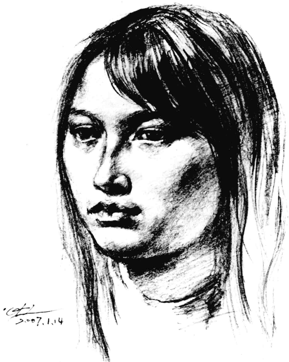
少女肖像（纸本、铅笔） 黄作林