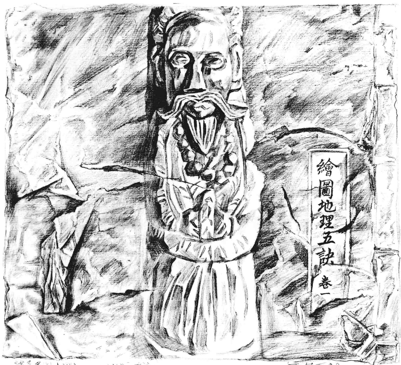
2008.9 藥師菩薩 —— 地脈之神 藥王菩薩 (紙本、鉛筆) 黃作林