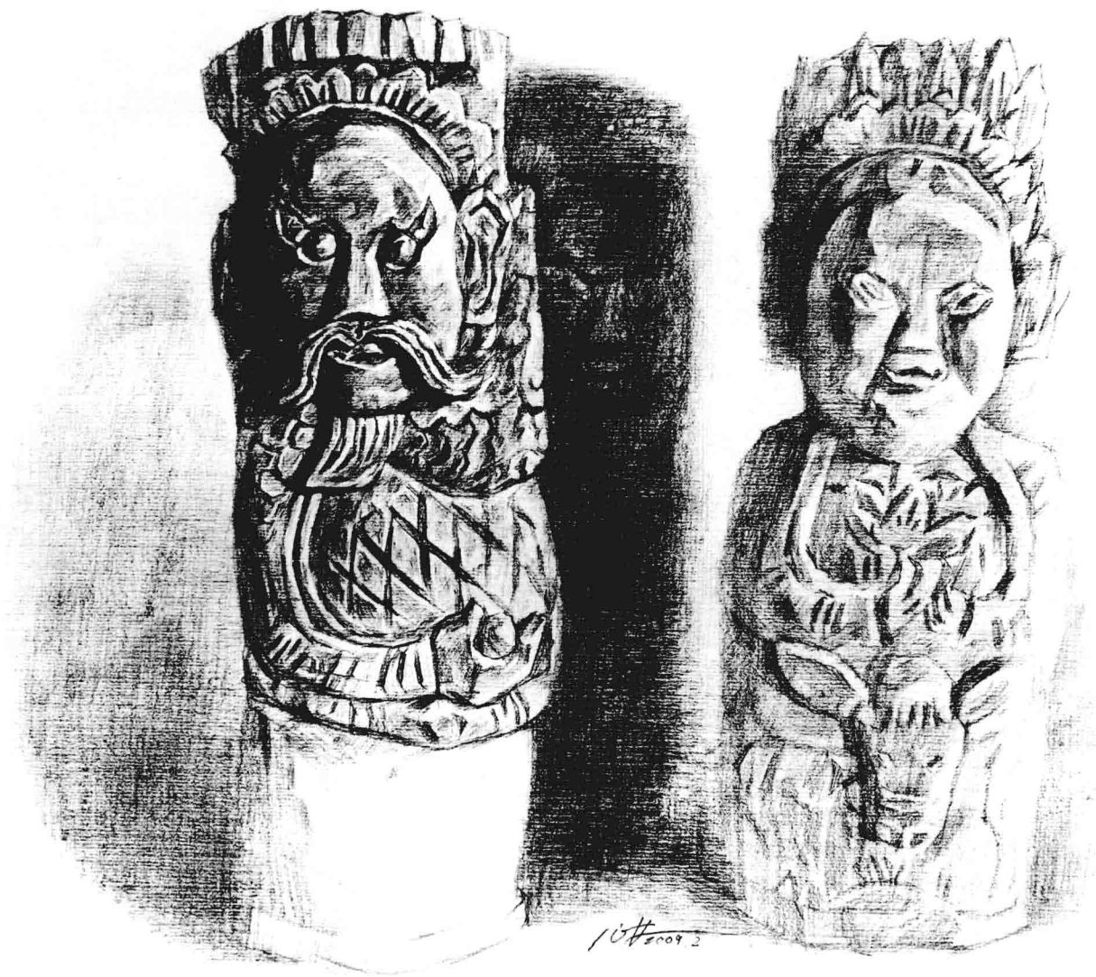
地脉龙神（纸本、铅笔） 黄作林