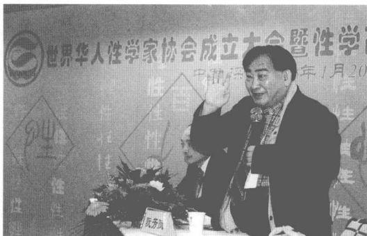
本书作者在世界华人性学家协会成立大会上发言。