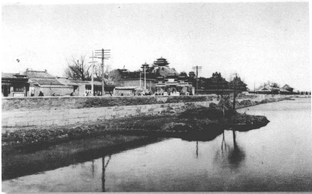
故宫角楼，1940年左右。