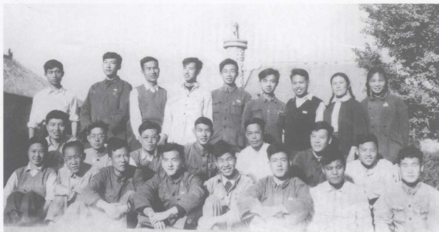
1961年北京大学56级同学合影（作者中排左二）