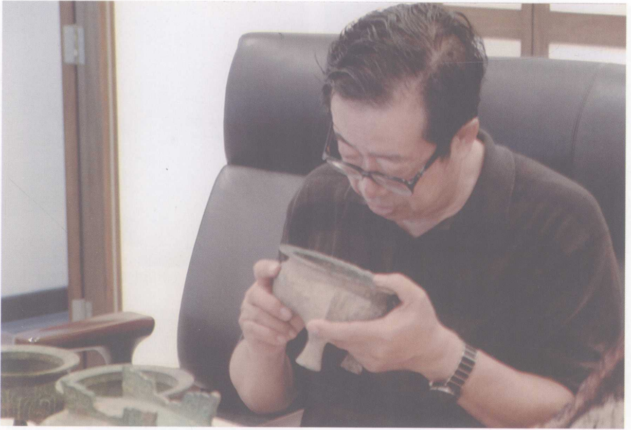
2005年作者在国家文物局鉴定青铜器