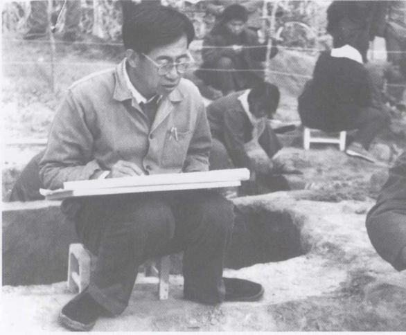
1980年在河南温县东周盟誓遗址发掘工地绘图