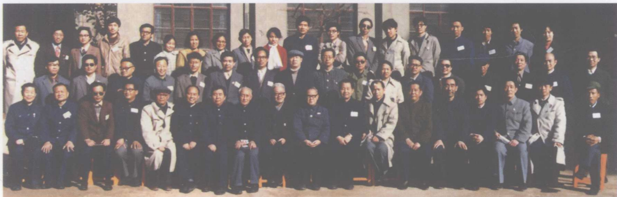
1986年11月全国科技史与文物考古工作会议与会代表在河南省文物研究所合影