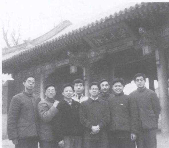
1963年北京大学历史系考古专业研究生合影（作者左一）