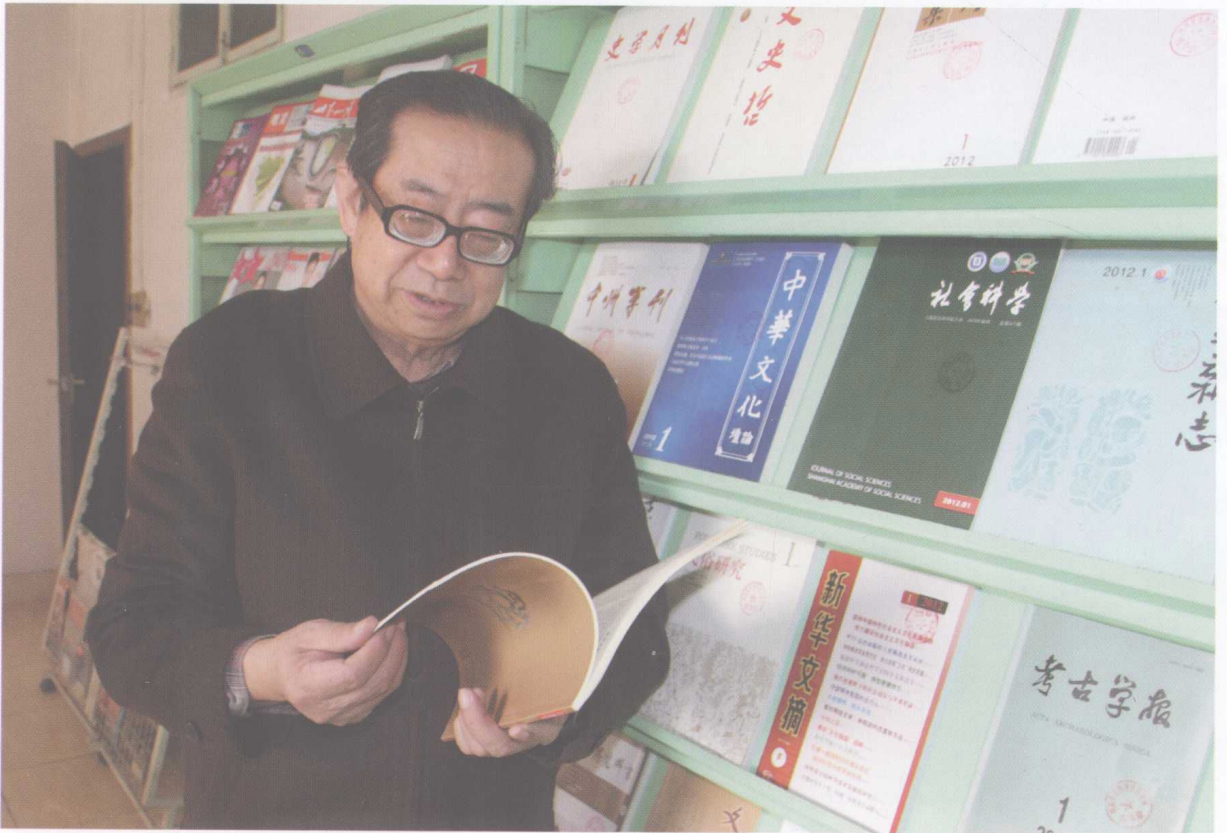
2012年2月作者在河南省文物考古研究所阅览室