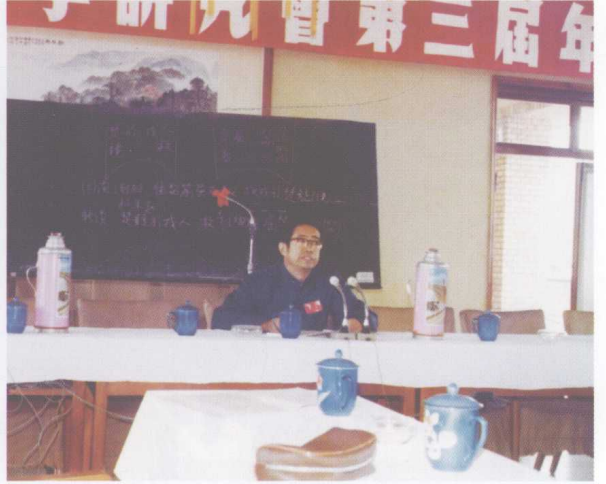
1980年9月作者在成都中国古文字研究 第三届年会上发言