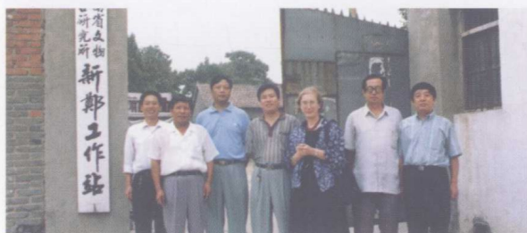
1997年9月作者与英国罗森博士在新郑参观（左五罗森、左六作者）