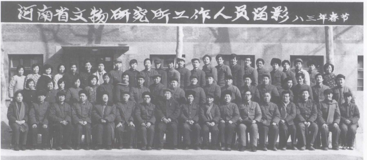
1983年春节河南省文物研究所全所职工合影