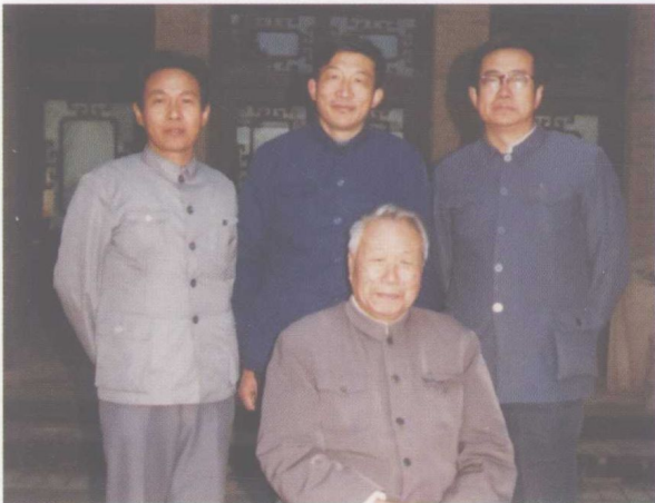
1985年作者在山西侯马晋文化国际讨论会期间与苏秉琦先生合影