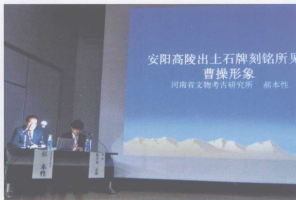
2011年10月作者在日本爱媛大学演讲