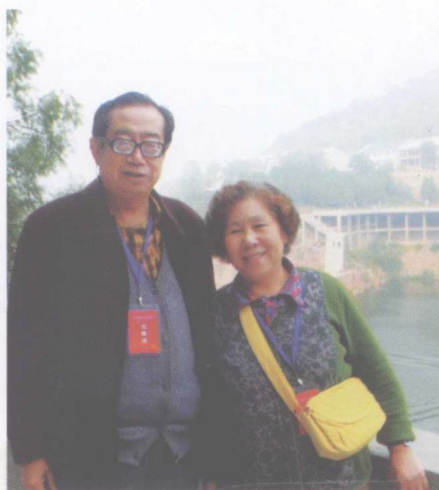
2010 年 10 月河北武安京娘湖畔 （武安为作者夫妇的祖籍）