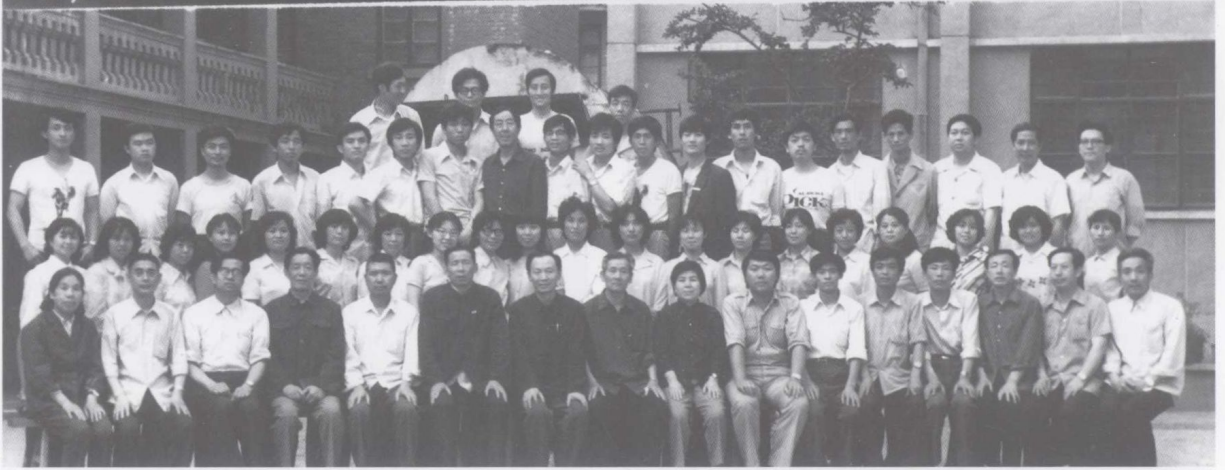
1985年国家文物局郑州培训中心第一期古钱币培训班合影