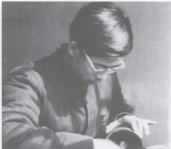
1961年9月在北京大学历史系考古教研室工作照