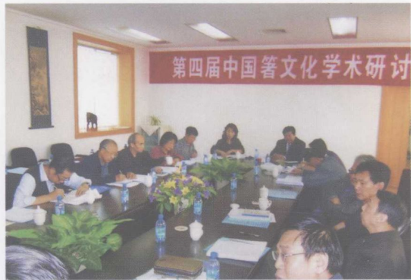
2006年10月19日作者在旅顺(左一为作者)