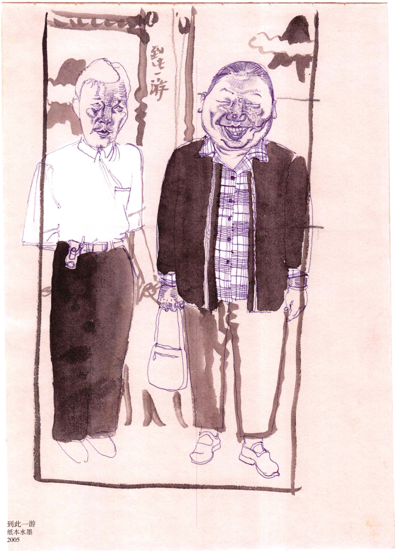
到此一游 纸本水墨 2005