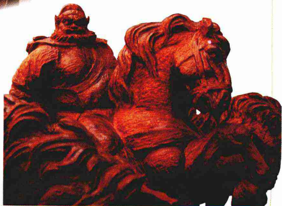
气壮山河（局部之二）