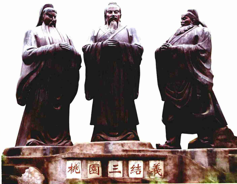
桃园三结义（园林铜雕）

型艺术家们给《三国演义》的人物造像时，也大多以蜀汉人物为主。在这本集中，特推出“桃园三结义”、“三英战吕布”、“铁骑逐中原”、“气壮山河”、“截江夺阿斗”、“三曹”、“远眺”等作品，形象地刻画了《三国演义》中的英雄名将。