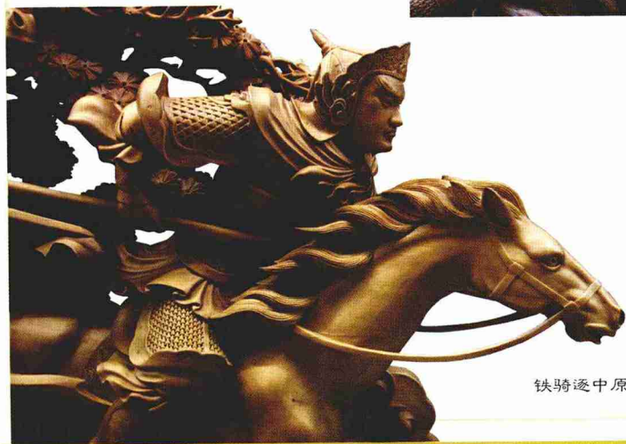
铁骑逐中原（局部之二）