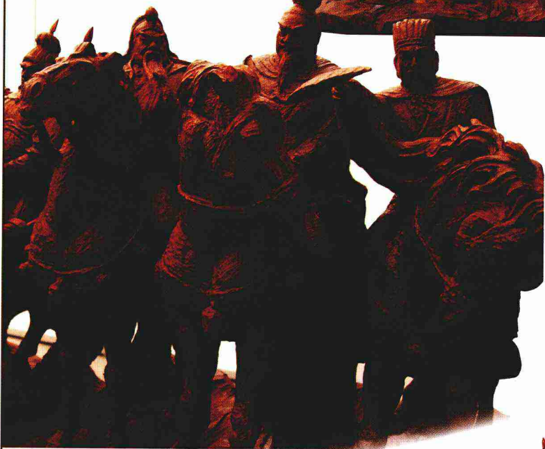
气壮山河（局部之一）