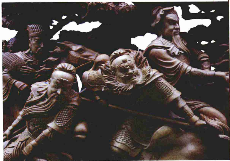
铁骑逐中原（局部之一）