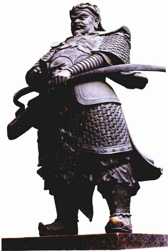
吴越王钱镠 杭州西湖边铜雕