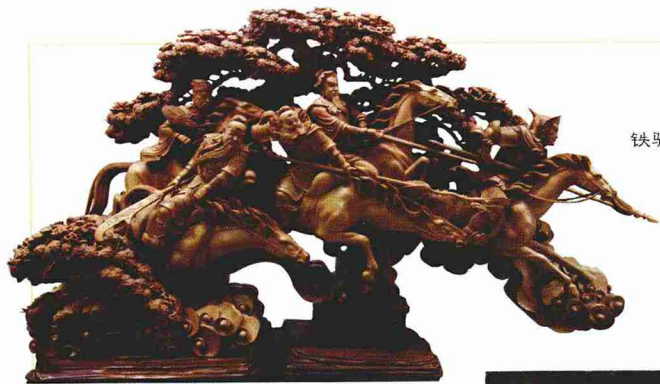
铁骑逐鹿中原 冯文士 冯晓峰