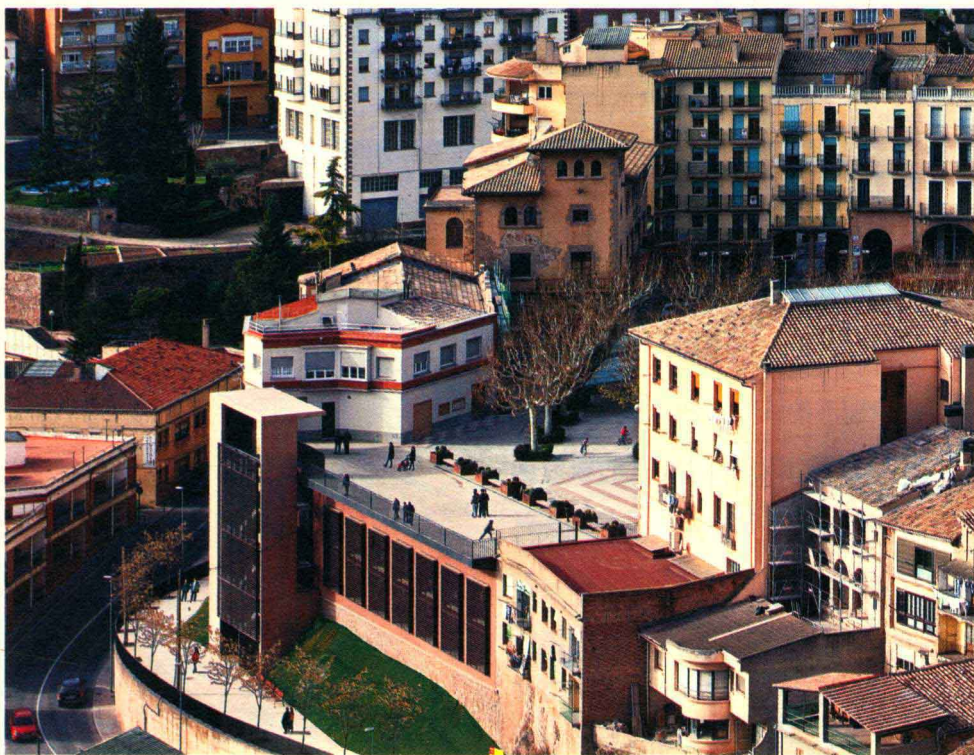
图2-2 卡多纳社区活动中心