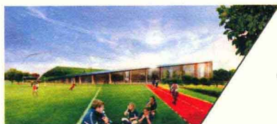
普尔森社区活动中心 PULSEN COMMUNITY CENTER