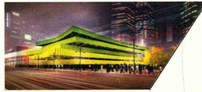
世宗社区活动中心 SOCIAL COMMUNITY CENTER