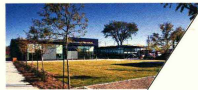
PIERREFONDS 社区活动中心 PIERREFONDS COMMUNITY CENTER