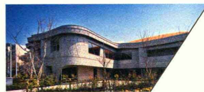
唐木田社区活动中心 KARAKIDA COMMUNITY CENTER