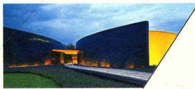
集美社区艺术中心 JIMEI COMMUNITY ART CENTER