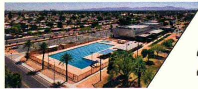
MARYVALE社区中心 MARYVALE COMMUNITY CENTER