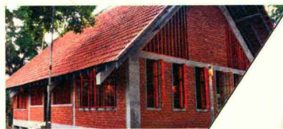
IFRC社区活动中心 IFRC COMMUNITY CENTER