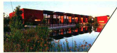
里约萨拉多奥杜邦中心 RIO SALADO AUDUBON CENTER