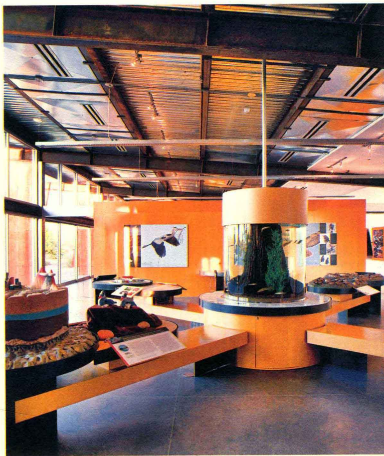
图3-1 里约萨拉多奥杜邦中心一层交往空间

无论研究哪一种空间环境，都要以人的行为作为出发点，设计者的空间构思必须围绕适用人群的心理需求和行为规律。同时，人类的活动过程不可能是个人独立完成的，完全独立于他人、社会、周边环境的活动是不存在的，自我的生存与发展总也离不开与他人的合作 (10) 。在社区活动中心这种促进知识文化、信息技术交流的地方，更应该鼓励交往行为的发生。无论在社区活动中心建筑的内部还是外部，能够引发人们自主沟通交流、激发本质精神的场所