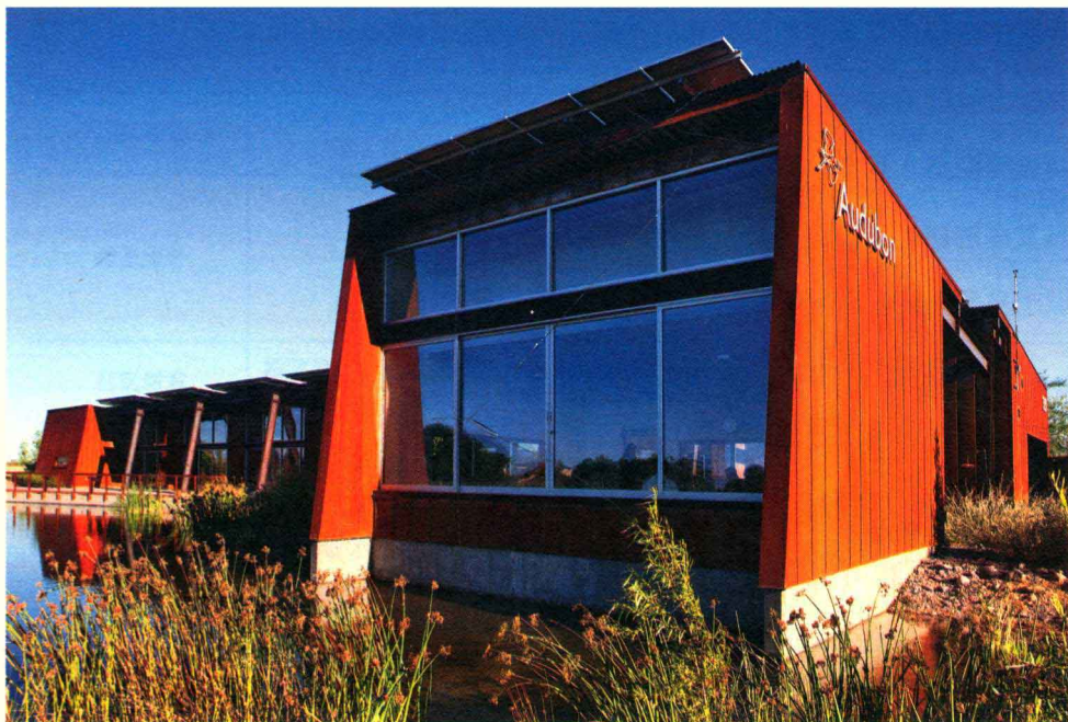
图2-1 里约萨拉多奥杜邦中心

对环境的再次破坏, 以及对历史文化的继承和保留。西班牙巴塞罗那的卡多纳社区活动中心就是由旧建筑改造扩建而来的, 设计者在尊重原有建筑结构的基础上, 仅对建筑表面和内部进行了修整。在建筑的前方加盖了一座既有楼梯又有电梯的直角形建筑。新的垂直建筑在连接核心的同时, 又解决了进入每层楼的交通问题。新旧体块有机地结合在一起, 形成绝妙的新旧对比, 建筑因此极具特色并为当地带来了生机与活力(图2-2)。