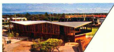
KEAST 社区公园展览馆 KEAST PARK COMMUNITY PAVILION