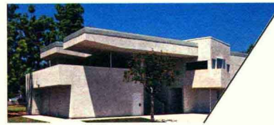
雷吉·罗德里格斯社区活动中心 REGGIE RODRIQUEZ COMMUNITY CENTER