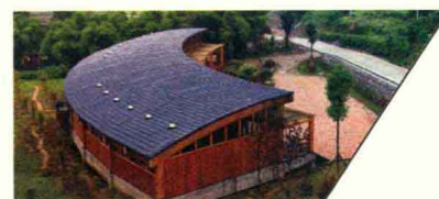
毕马威安康社区中心 KPMG-CCTF COMMUNITY CENTER