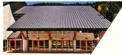
格伦伊格尔斯社区活动中心 GLENEAGLES COMMUNITY CENTER