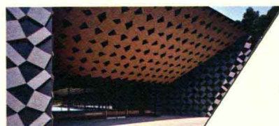
金山社区活动中心 KANAYAMA COMMUNITY CENTER