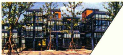
康居社区活动中心 KANGJU COMMUNITY CENTER