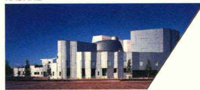
卡达莱文化中心 YURIHONJO CITY CULTURAL CENTER, KADARE