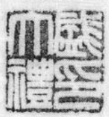
黄石市政协主席盛大禮題詞