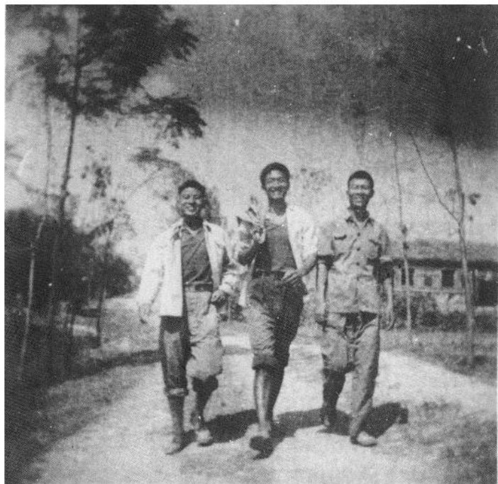
作者(中)上山下乡时摄于农村