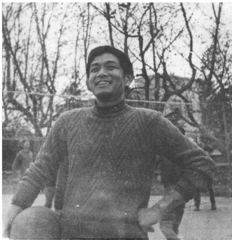
作者就读华中工学院时摄于校园