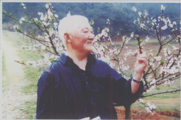
作者2009年摄于莲荷村