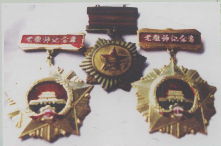
作者获得的荣誉证书选登