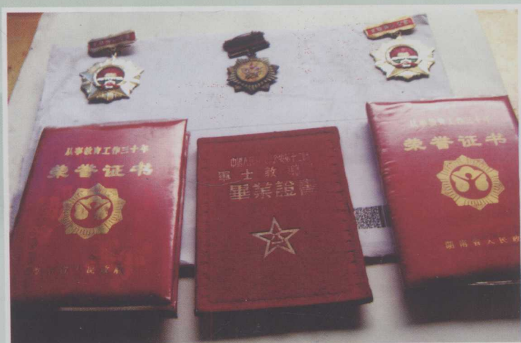
作者获得的荣誉证书选登