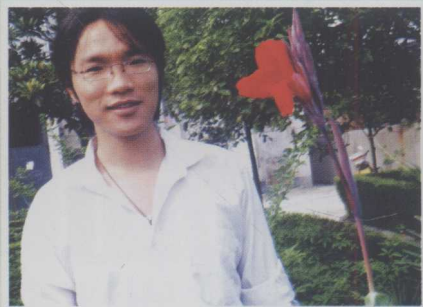
作者孙子欧阳志儒