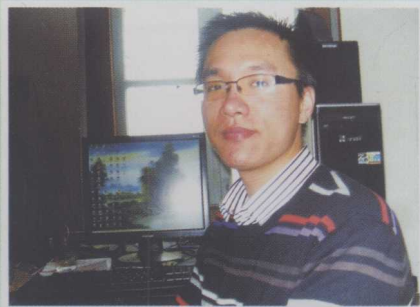
作者孙子欧阳一儒