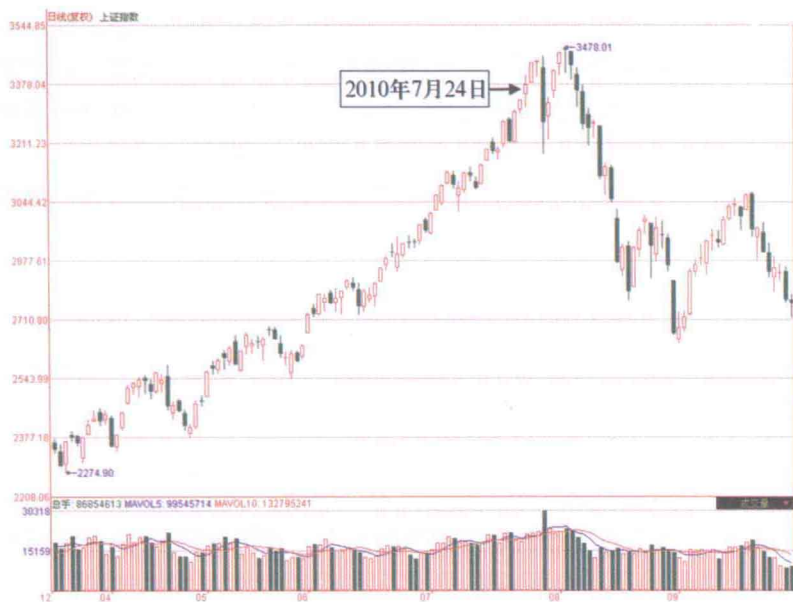
图1-3 上证指数2010年7月24日前后走势图

在分时图窗口中，我们还可以看到红绿柱状线，红色的柱状线出现在零轴上方（注：所谓的零轴是指上一交易日的收盘点位），绿色的柱状线则出现在零轴下方，红绿柱状线实时地反映了股市中全体个股的总买盘量与总卖盘量的比值。当红色柱状线出现时，表示目前市场中总体买盘数量大于卖盘数量，大盘指数在这一时刻处于上涨状态，红色的柱状线越长，则表明市场中的总买盘数量越大，是市场呈强势运行的表现；当绿色柱状线出现时，表示目前市场中总体卖盘数量大于买盘数量，大盘指数在这一时刻处于下跌状态，绿色的柱状线越长，则表明市场中的总卖盘数量越大，是市场呈弱势运行的表现。