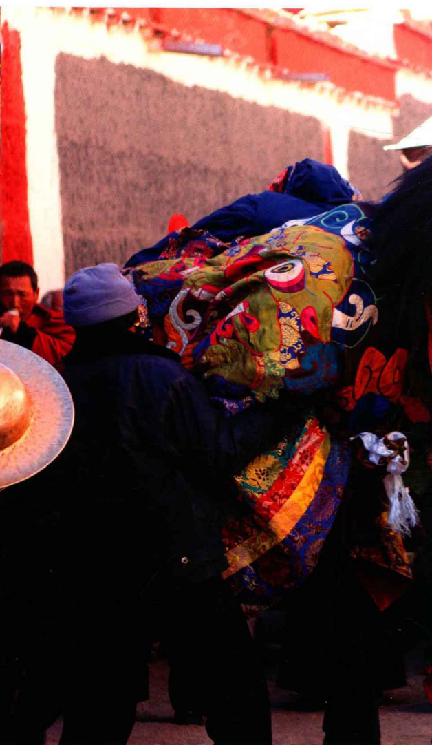
玛哈嘎拉兄妹 Mahakala Brother and Sister