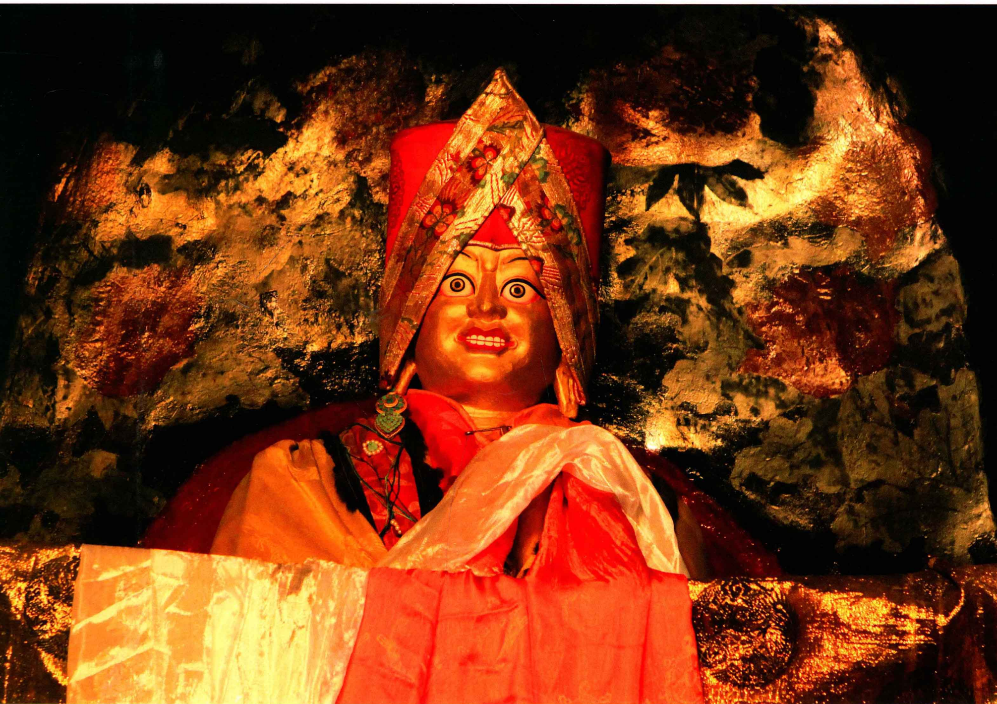
萨迦法王阿旺·贡嘎仁钦像 Sakya Dharma King, Ngawang Kunga Rinchen (1517-1584)