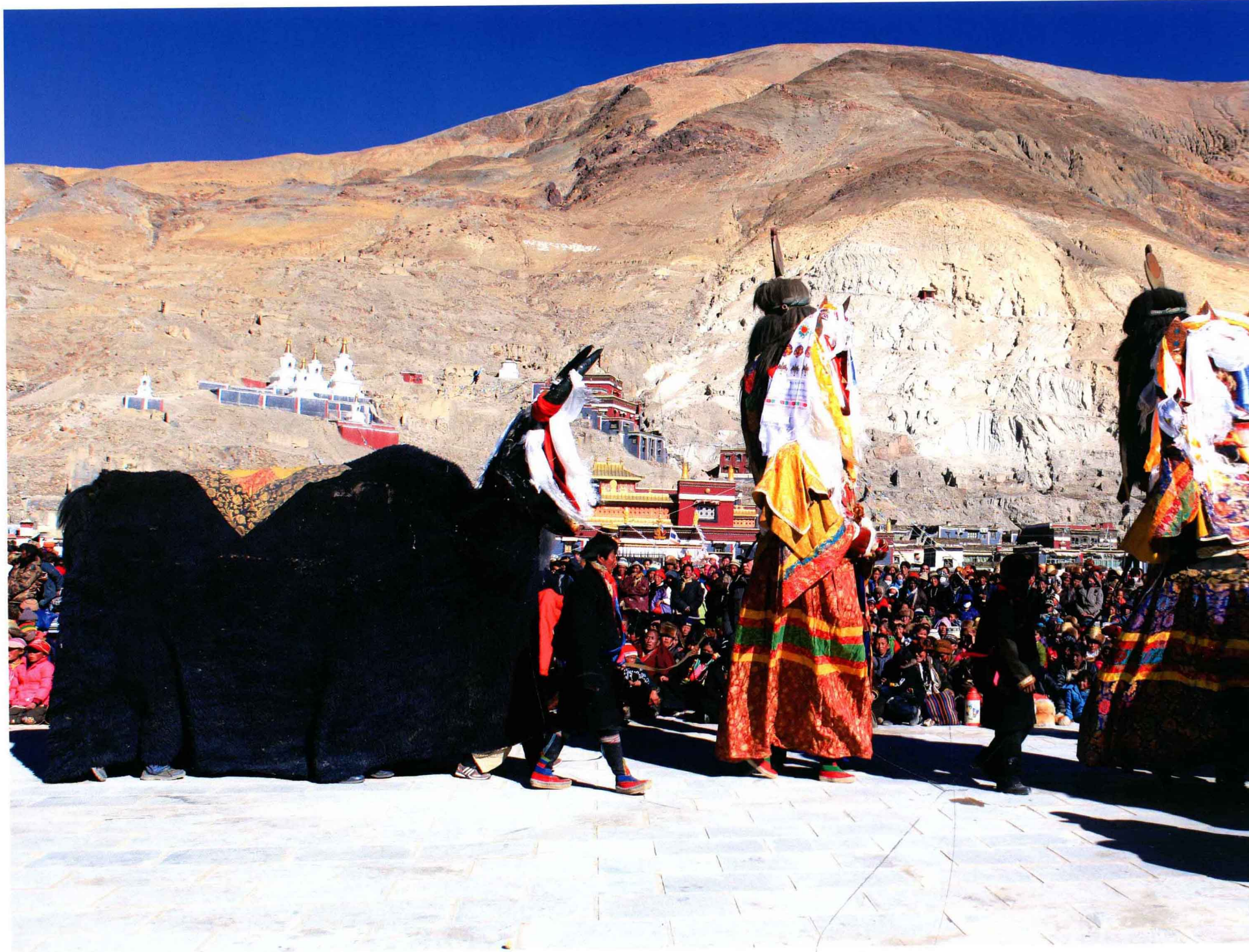
奔波山下的盛大舞会 Dancing Ceremony at the foot of Ponpori Hills