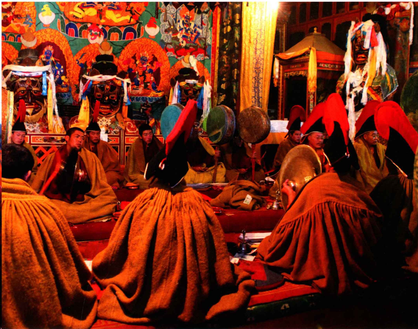
迎请玛哈嘎拉兄妹至普巴殿 Receiving Mahakala Brother and Sister in Phurpa Lhakang