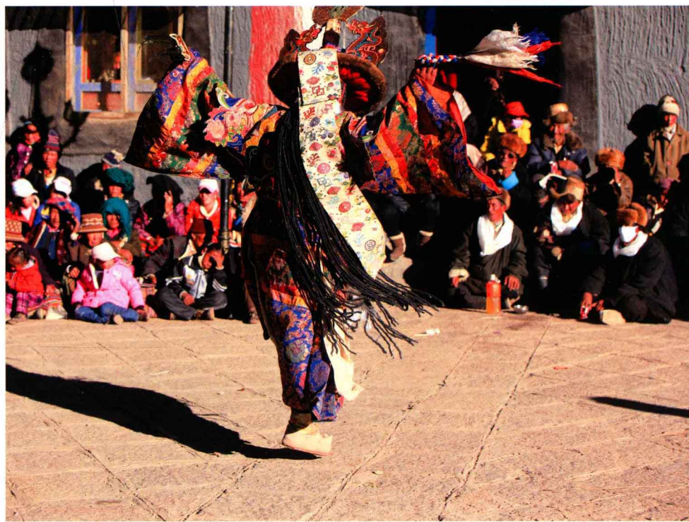
谢幕前的金刚舞 Vajra Divine Dances at the end of ceremony