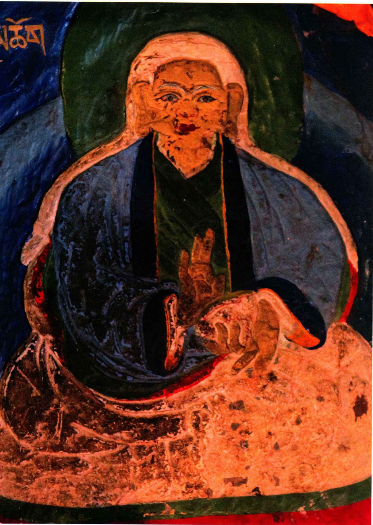
萨迦寺的创建者昆·贡却杰布像 The Founder of Sakya Monastery, Khön Konchog Gyalpo (1034-1102)