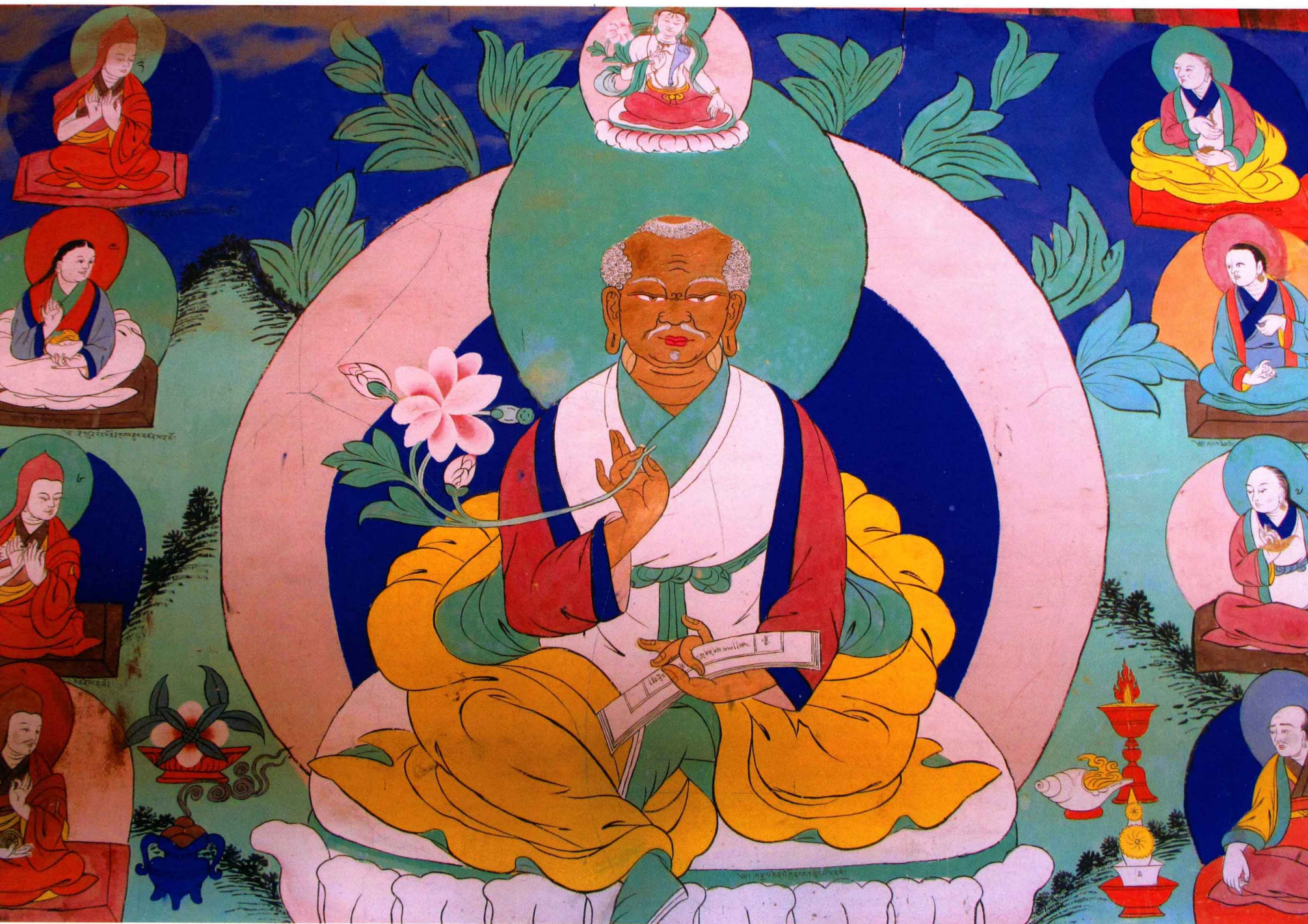
萨迦初祖萨钦·贡噶宁布像 Statue of the First Patriarch of Sakya Order, Kunga Nyingpo (1092-1158)