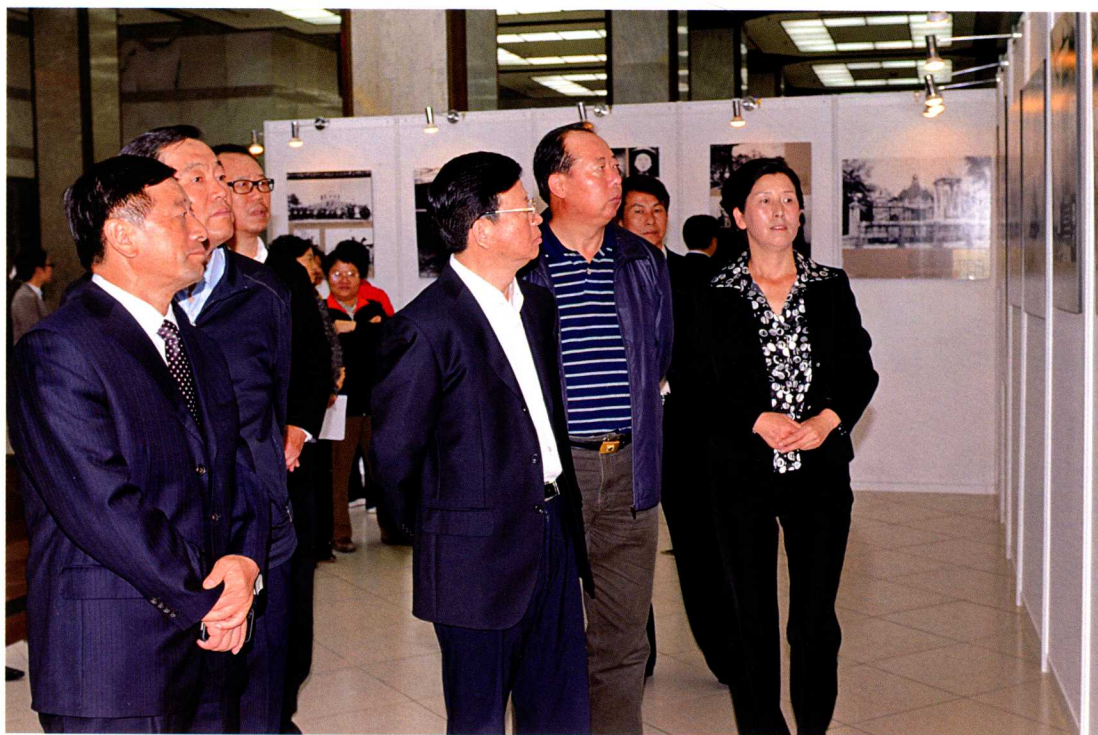
中共中央政治局常委、全国政协主席贾庆林，全国政协副主席兼秘书长钱运录观看“回望壹玖壹壹——海峡两岸纪念辛亥革命一百周年”图片展。