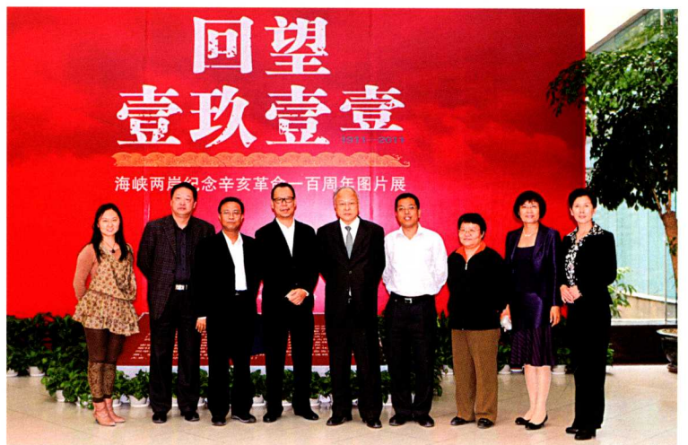
应邀参加纪念大会的辛亥革命先辈后裔、海外嘉宾，有关专家、学者观看“回望壹玖壹壹——海峡两岸纪念辛亥革命一百周年”图片展。