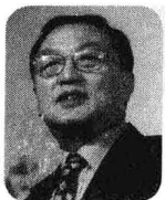
柳传志 >> 联想控股有限公司前董事长