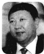
牛根生 >> 蒙牛集团的创立者