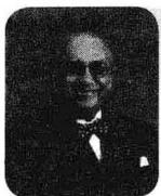
科特勒 >> 现代营销学之父

若没有真正的整合，而只是想靠一网打尽营销传播战术来求得消费者掏心、掏肺、掏钱包的战果，无异于缘木求鱼。