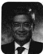
郎咸平 >> 著名经济学家，香港中文大学金融学教授