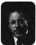
杰·亚布拉罕 >> 世界营销大师

中国品牌国际化，并不是仅指打造中国品牌，更好的一条路是通过整合的手段兼并、收购国外的品牌，通过这样的途径入市。