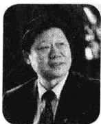
张瑞敏 >> 海尔集团董事局主席兼首席执行官