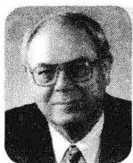
唐·舒尔茨 >> 整合营销大师

若没有真正的整合，而只是想靠一网打尽营销传播战术来求得消费者掏心、掏肺、掏钱包的战果，无异于缘木求鱼。