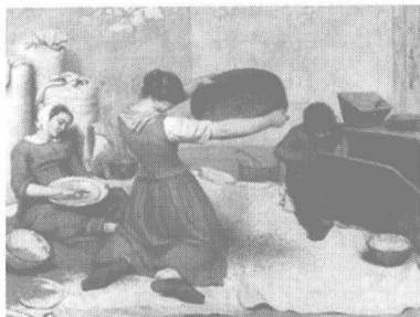
图 0-2 《筛麦的妇女》