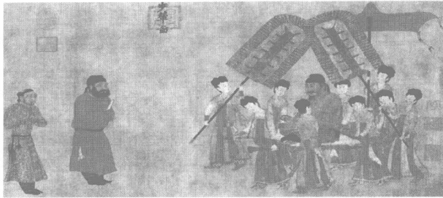
图 0-3 《步辇图》

创作艺术的同时，通过创作艺术来认识人性以及自然，用艺术来表达内涵和本质，或是通过认识艺术并且了解和认识其所表达的内涵和本质，在获得精神层面的感官刺激的同时，使人的精神面貌获得升华，从而树立正确的人生观和价值观，这是艺术的教育过程。艺术的教育作用之所以如此重要，其本质在于艺术的创作过程本身就是一种文明的创作过程，正因为它是一种文明的创作过程，才决定了它所承载的文明信息具有举足轻重的教育作用。