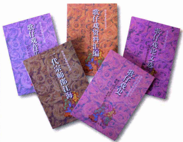
1997年，光明日报出版社出版我所编著的《歌仔戏艺术研究丛书》