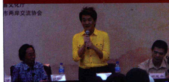
市文化厅 市两岸交流协会