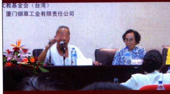
文教基金会 (台湾) 厦门烟草工业有限责任公司