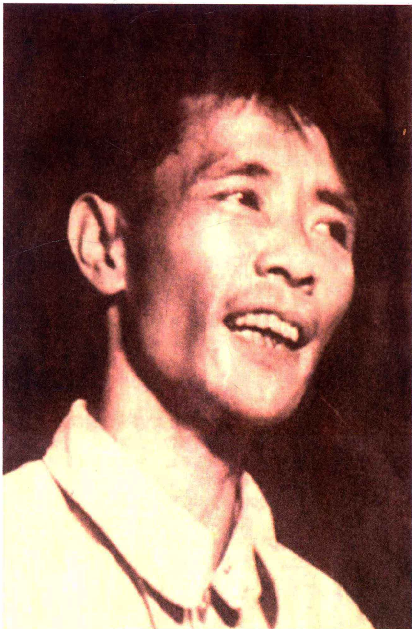
歌仔戏一代宗师邵江海