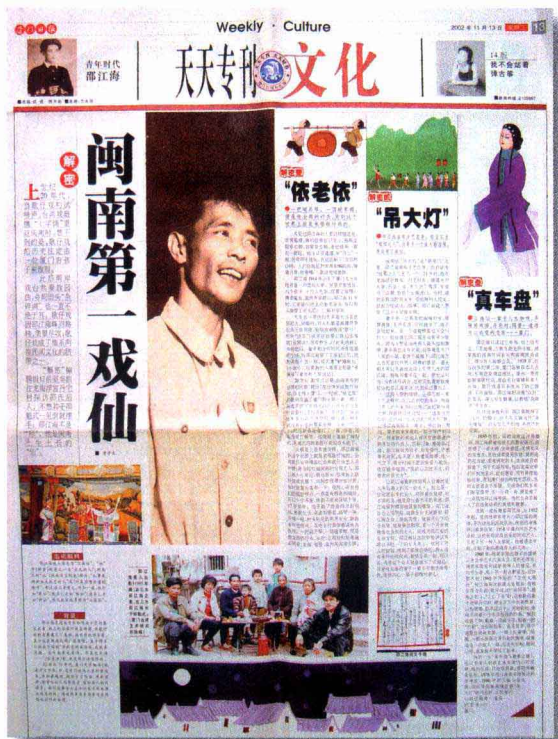
一位只上过三年私塾的民间艺人，却成为一个时代民间文化的代表