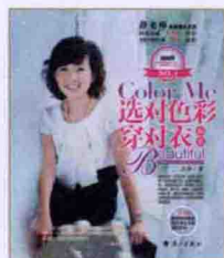
选对色彩穿对衣 修订版