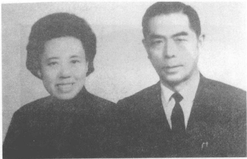
屈萬里先生伉儷合影，攝於一九六九年十一月六日