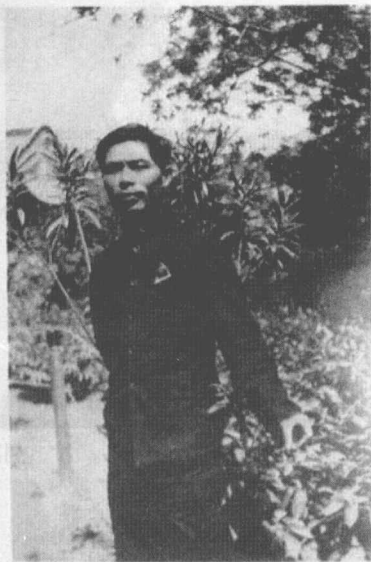
屈萬里先生一九三二年時之留影